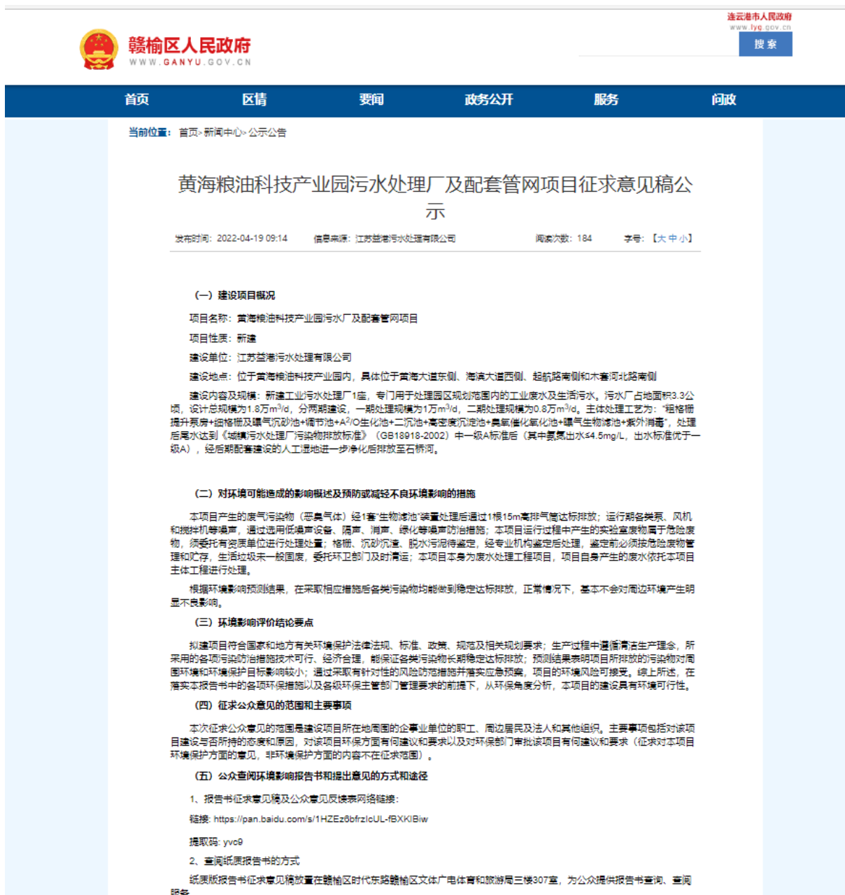
图 3.2-1 本项目征求意见稿公示截图