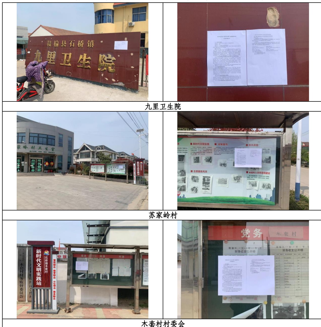
图 3.2-4 张贴公示现场照片

本项目于2022年4月20日起在项目周边木套村村委会、九里卫生院、苏家岭村进行了张贴公告的公示。公示现场照片如图3.2-4所示。