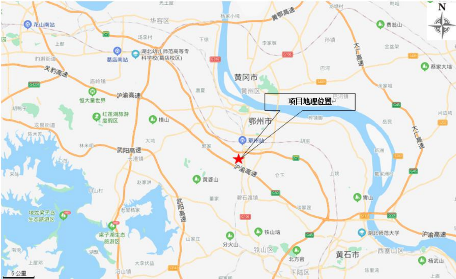
附图 1 项目地理位置图