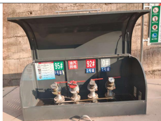
卸油口及卸油口油气回收