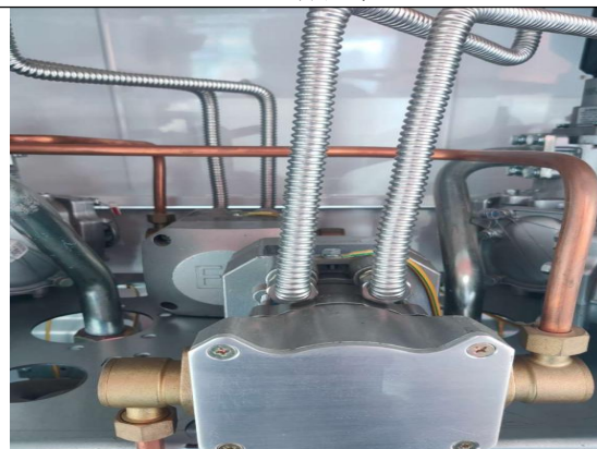
加油机油气回收系统