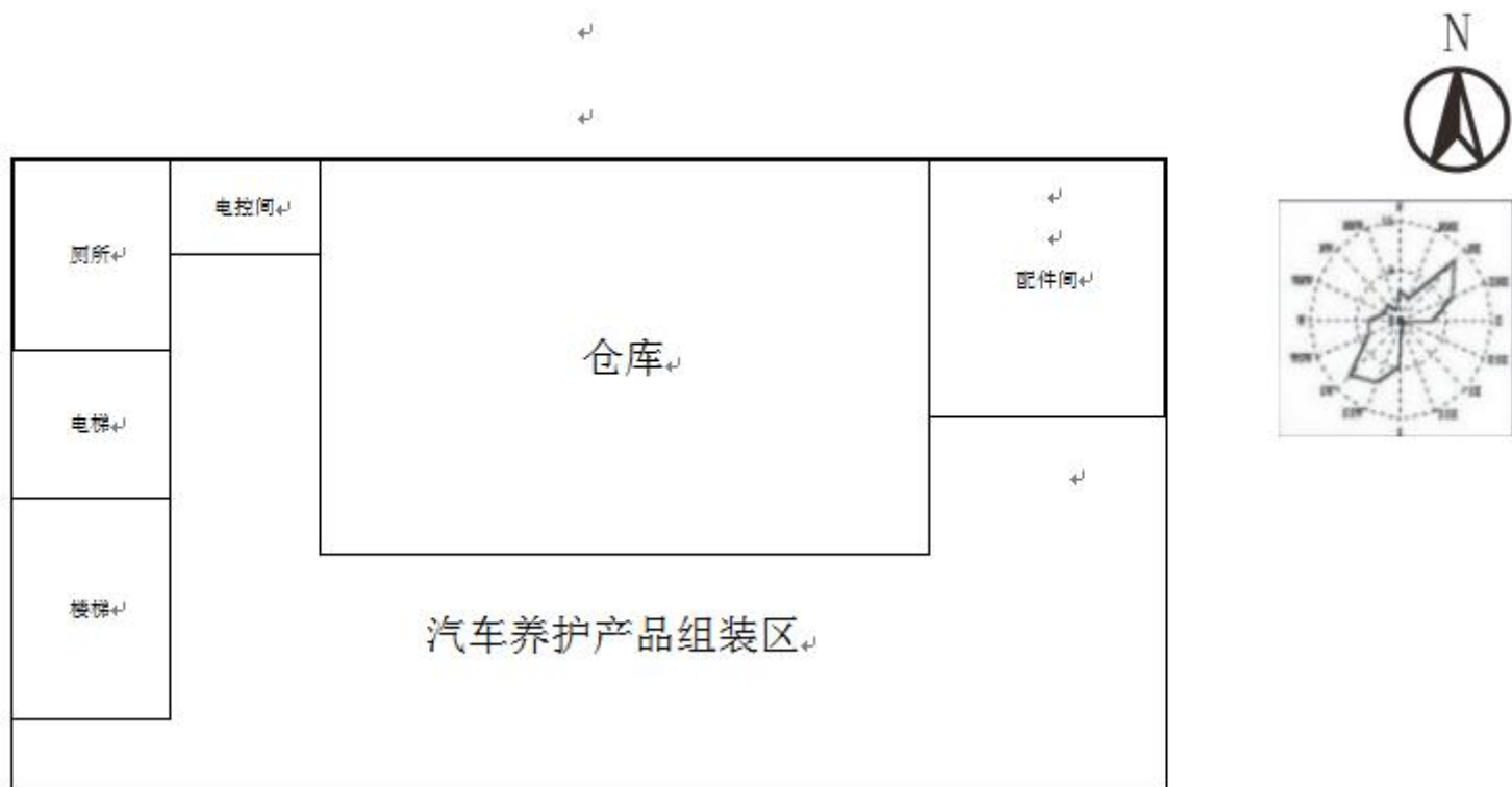
附图3-3 项目三层平面布置图（1:160）