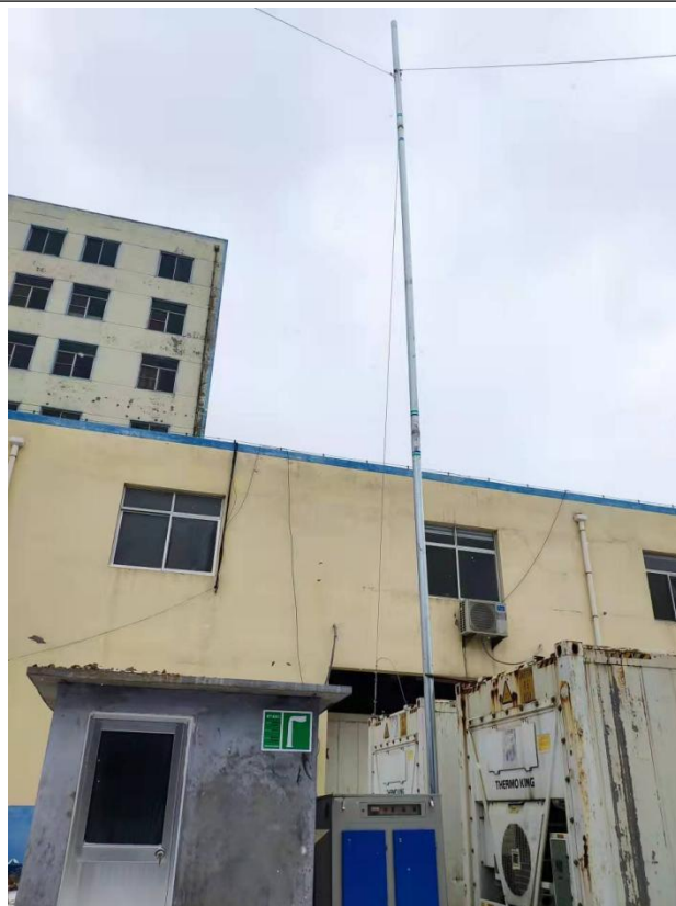
污水站废气排气筒