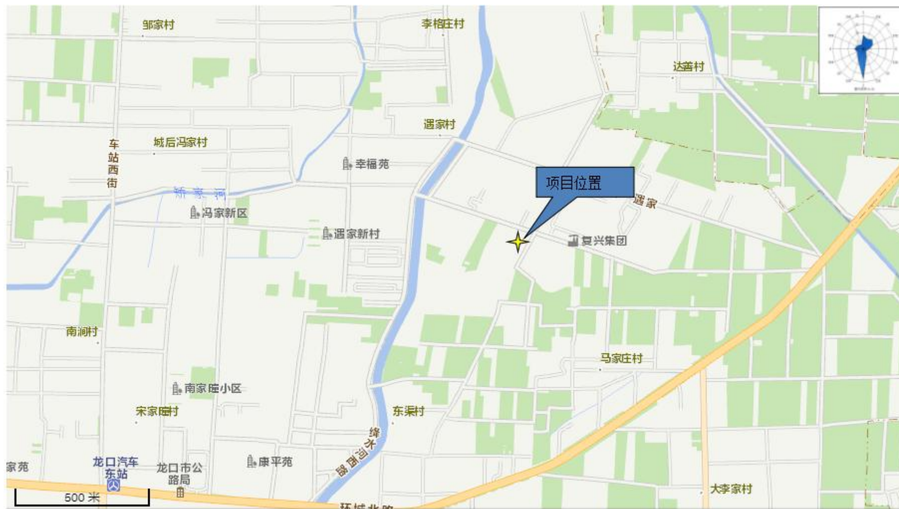
附图 1 项目地理位置图