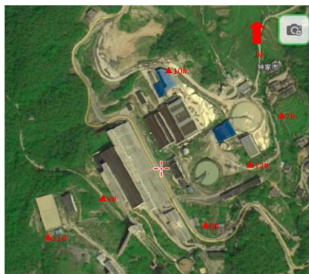
噪声监测点 (钟家市选矿厂 7#~12#)