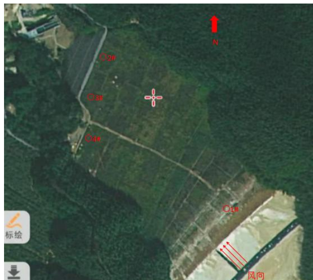
无组织废气检测点 (2 号尾矿库)