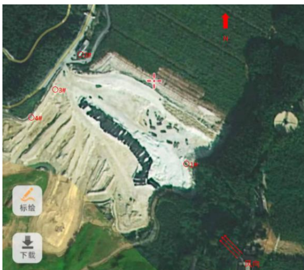
无组织废气检测点 (1 号尾矿库)