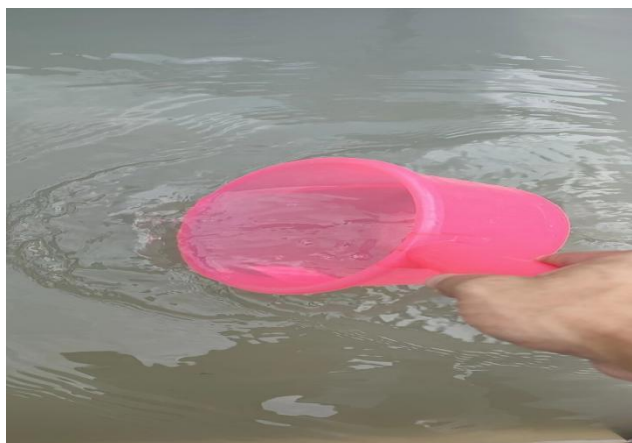
生产废水总排放口