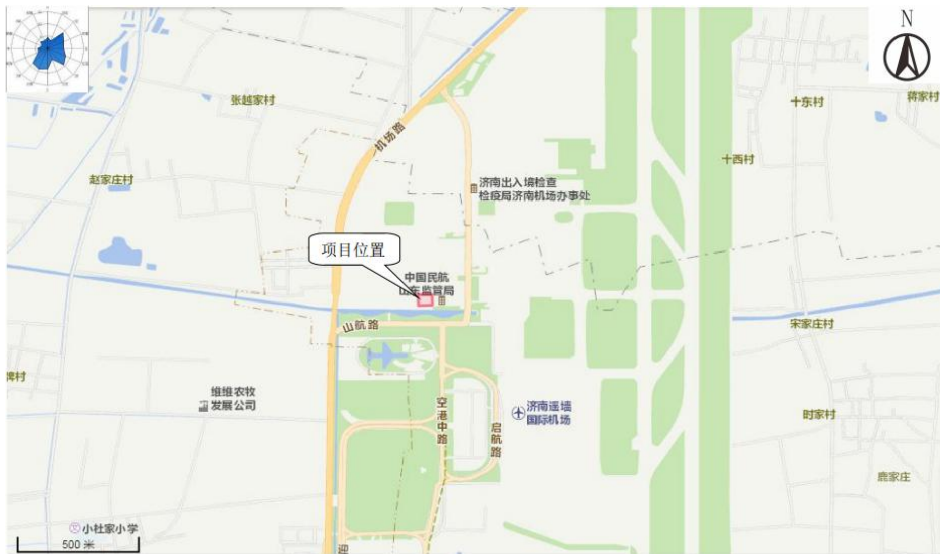
附图1 项目地理位置图