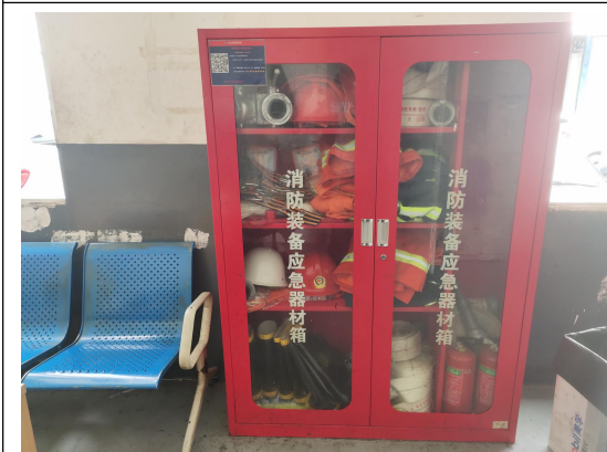
十五、消防装备应急器材