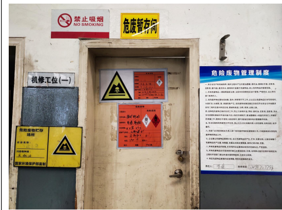
十一、2#危险废物暂存间