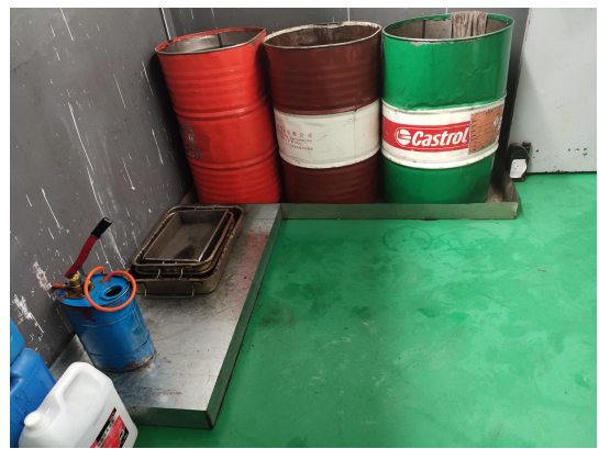
十二、环氧树脂防渗