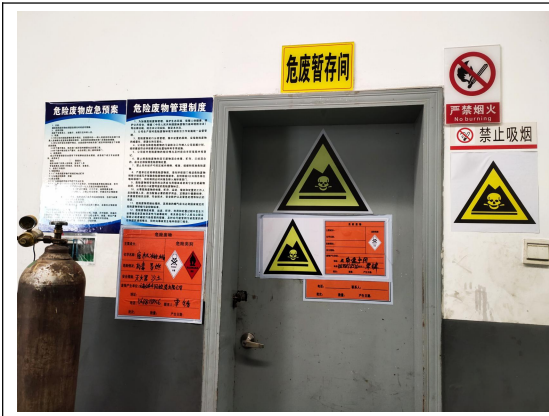
九、1#危险废物暂存间