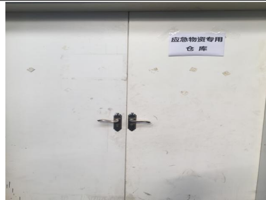
十四、应急物资仓库