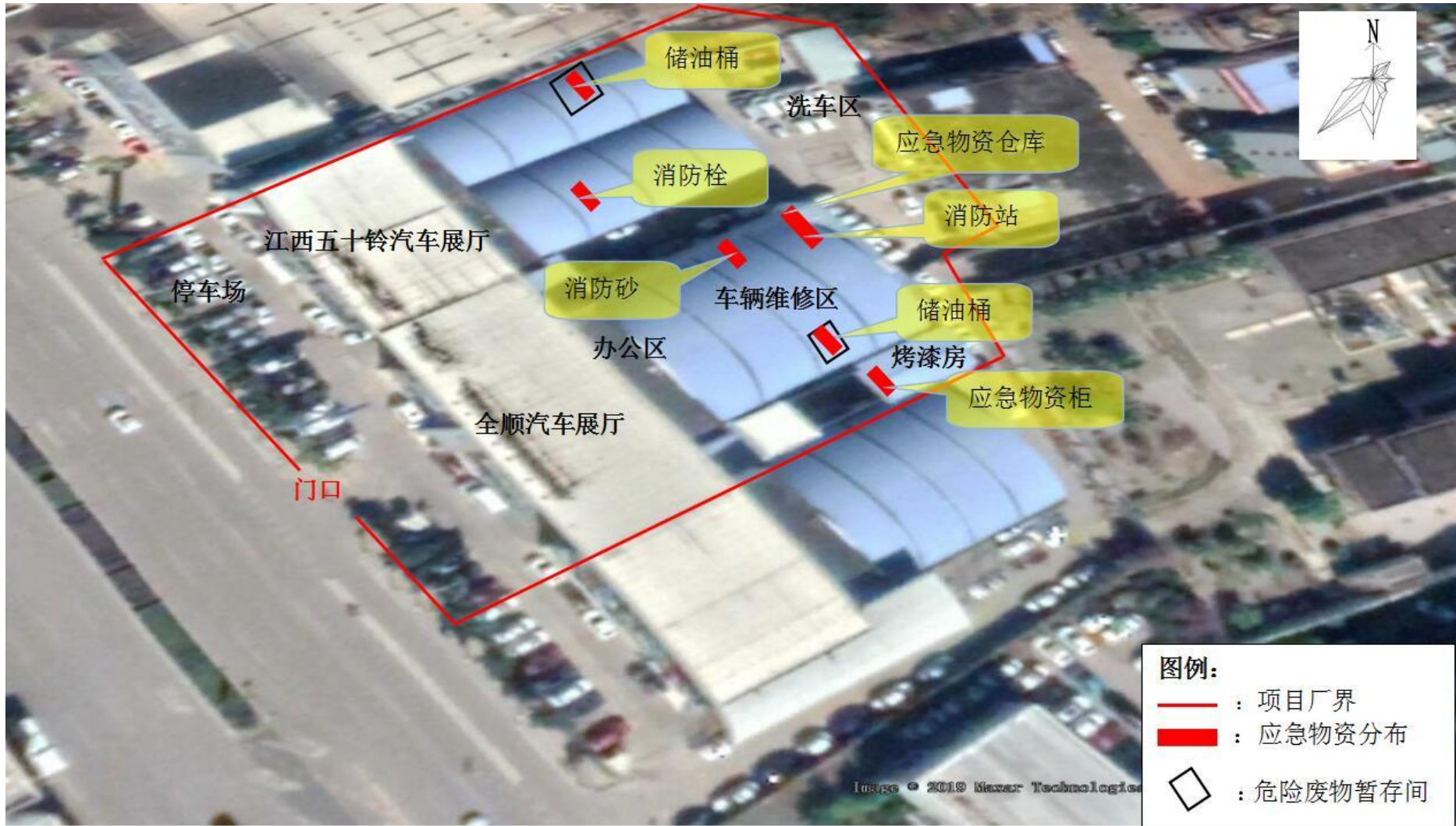
附件三 应急物资分布示意图