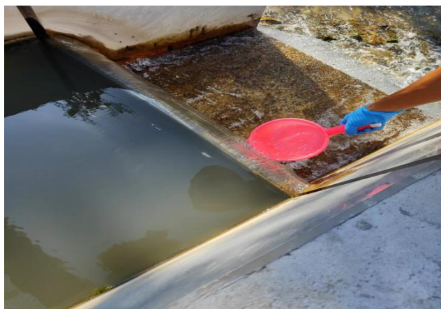
生产废水总排放口