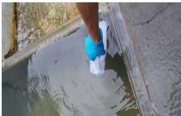
生产废水总排放口