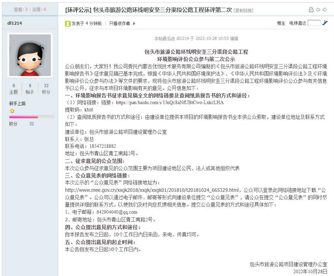
图 3.2-1 二次公示截图

我公司在环境影响报告书基本完成后，在报送环境保护行政主管部门审批前，于2022年10月28日至2022年11月10日开展第二次公示，建设单位通过网络平台（ https://www.ep-home.cn/thread-11656-1-1.html ）公开二次公示信息。公示截图见图3.2-1。