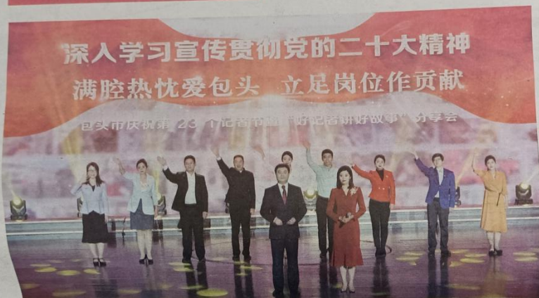
记者们讲述自己的新闻故事

11月8日,由中共包头市委宣传部主办,包头广播电视台、包头日报社联合举办的《深入学习贯彻党的二十大精神 满腔热忱爱包头 立足岗位作贡献》——包头市庆祝第23个记者节暨“好记者讲好故事”分享会在包头广播电视台上演。