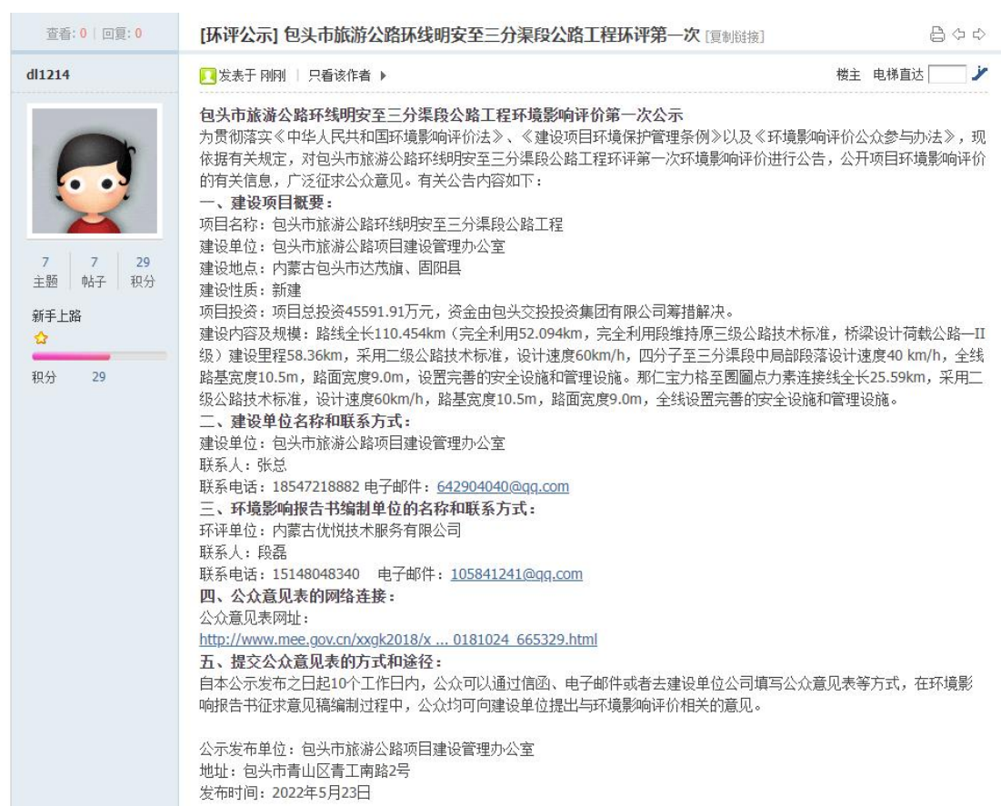
图 2.1-1 一次公示截图