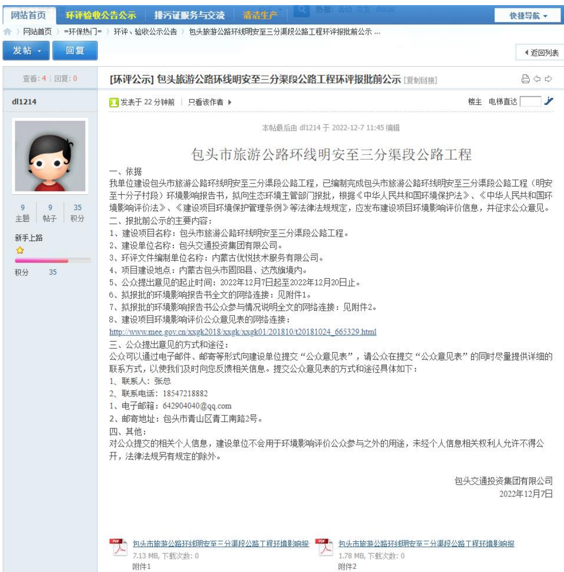
图 4.1-1 拟报批前网上公示截图

在报批环境影响报告书前，包头交通投资集团有限公司于 2022 年 12 月 7 日在环保之家网站（ https://www.ep-home.cn/thread-12548-1-1.html ）上对报告书全文和公众参与说明进行了网络公示。公示内容截图见图 4.1-1。