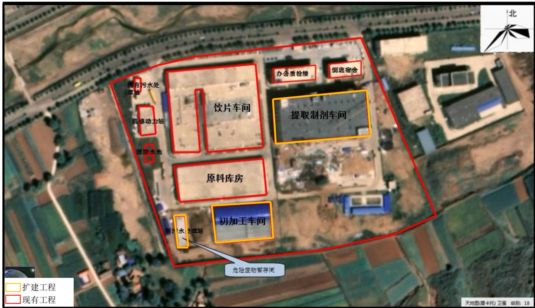
图 3.2-3 厂区平面布置图