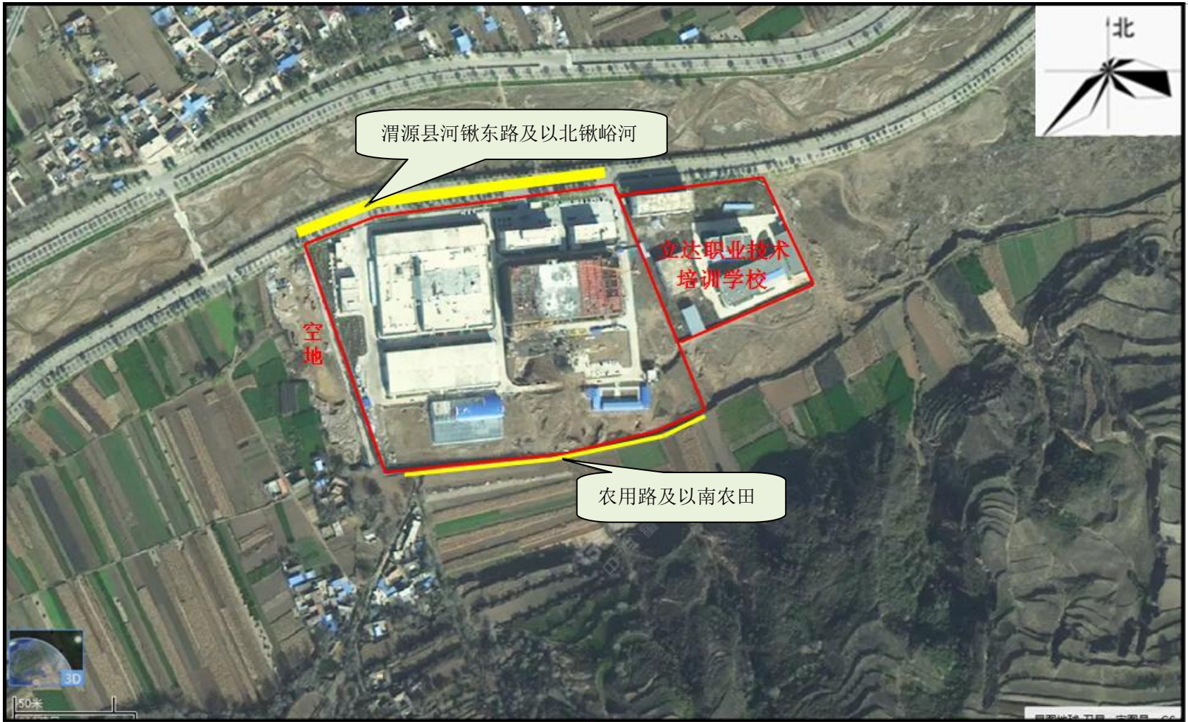
图 3.2-2 建设项目周边关系图