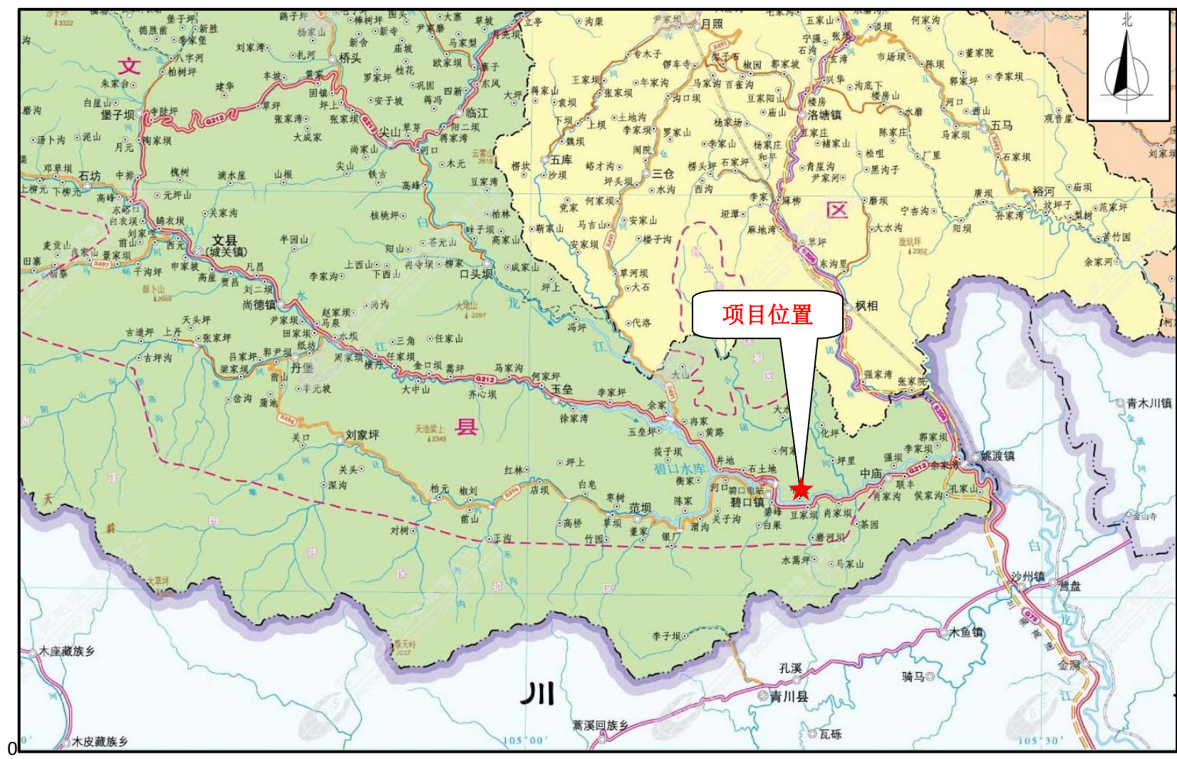
图 1 项目地理位置图