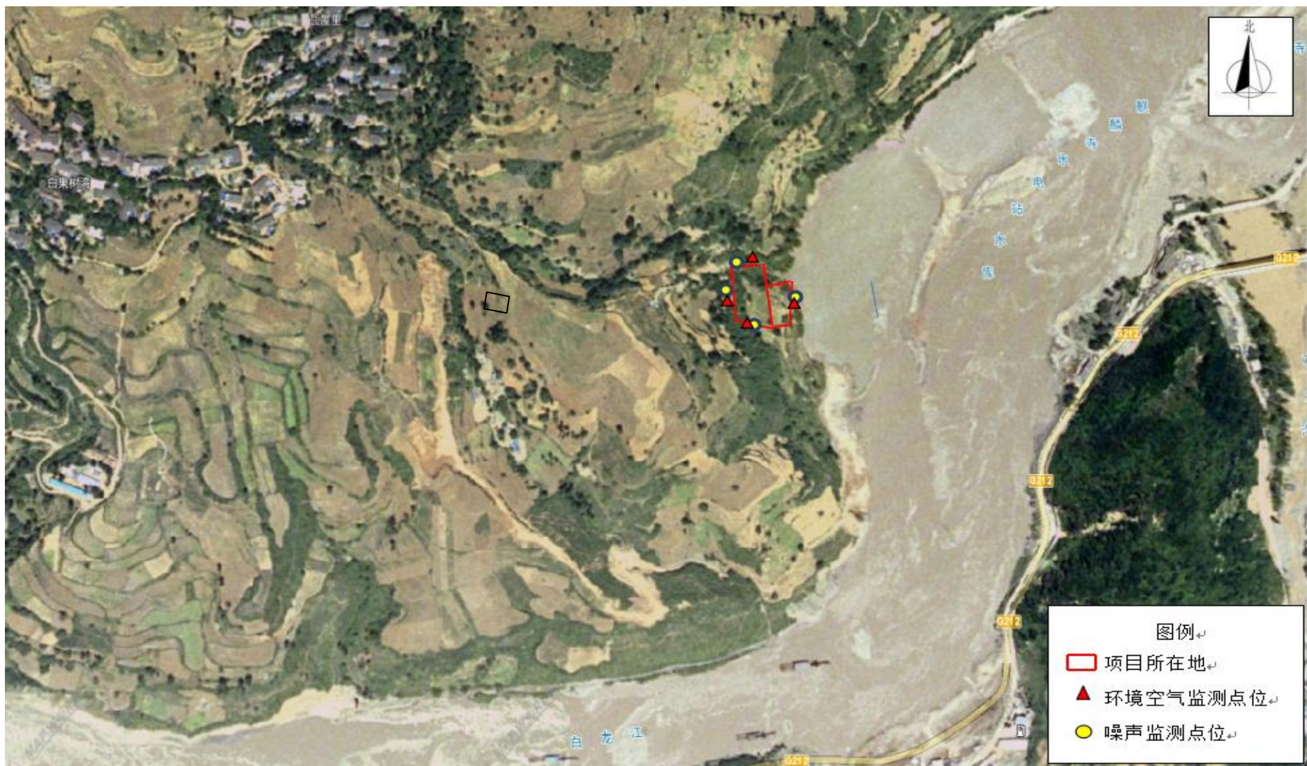
图3 环境质量监测点位布设图