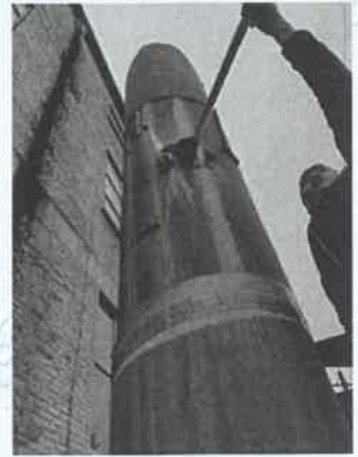
坪石选矿厂中碎除尘器出口