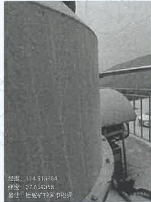
钟家市选矿厂粗碎除尘器出口