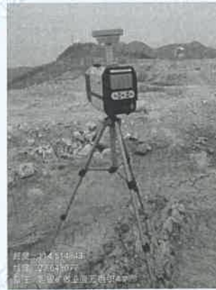
采矿场工业面 4#下风向