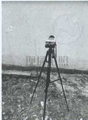
坪石选矿厂噪声监测 15#