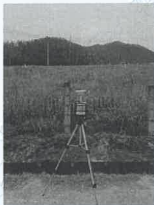
2 号尾矿库坝面 3#下风向