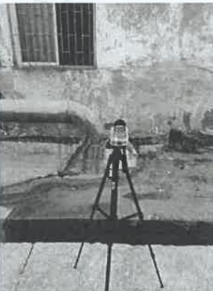
钟家市综合回收车间 9#