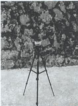
坪石选矿厂噪声监测 14#