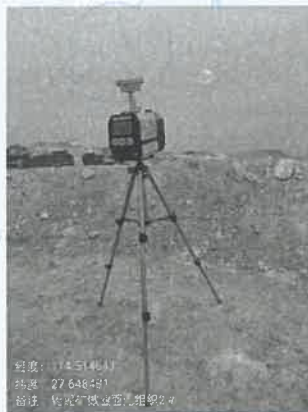
采矿场工业面 2#下风向