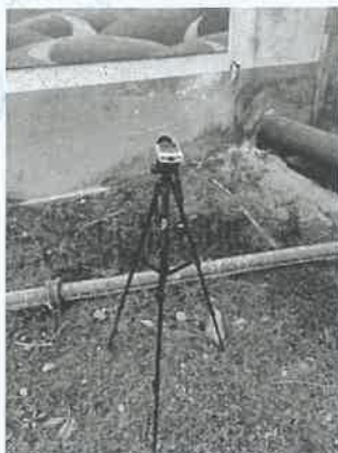
坪石选矿厂破碎车间 17#