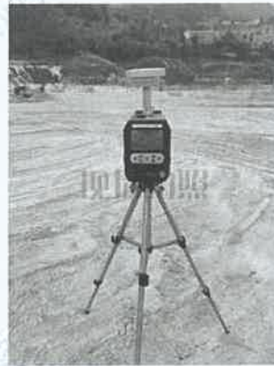
1 号尾矿库坝面 4#下风向