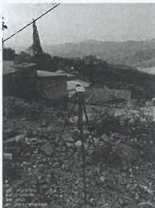
坪石选矿厂回收车间 21#