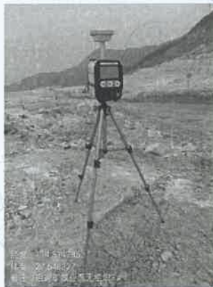
采矿场工业面 3#下风向