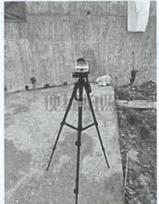
坪石选矿厂破碎车间 16#