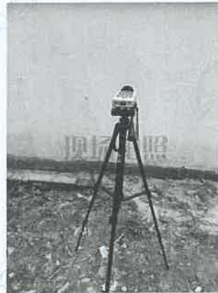
坪石选矿厂主厂房 20#