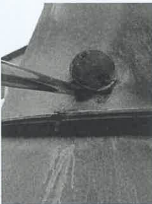
钟家市选矿厂细碎除尘器出口