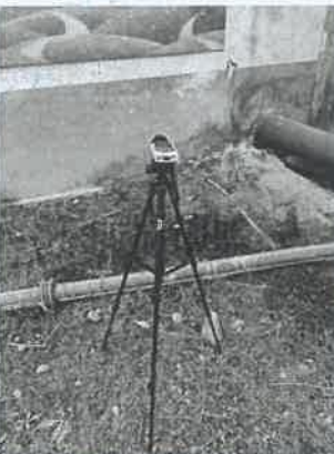
坪石选矿厂噪声监测 13#