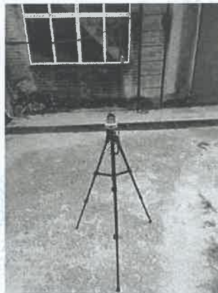
坪石选矿厂主厂房 19#