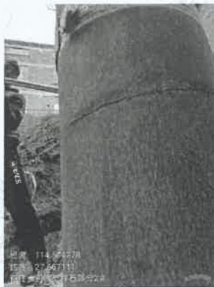
坪石选矿厂筛分除尘器 出口 2#