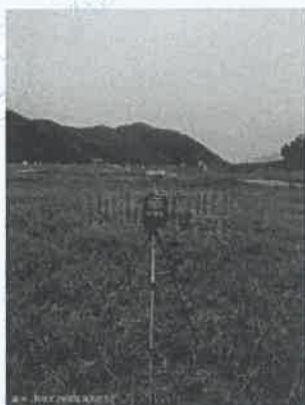
2 号尾矿库坝面 1#上风向