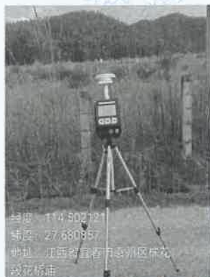
2 号尾矿库坝面 2#下风向