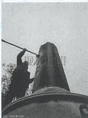
坪石选矿厂细碎除尘器 出口