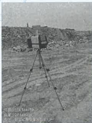
采矿场工业面 1#上风向