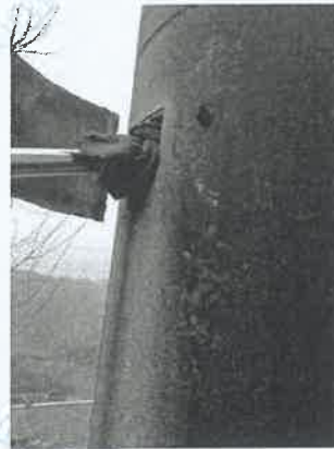
坪石选矿厂皮带除尘器 出口