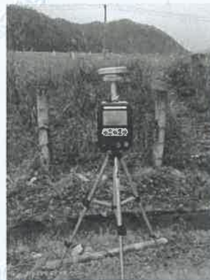
2 号尾矿库坝面 4#下风向