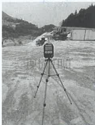
1 号尾矿库坝面 2#下风向