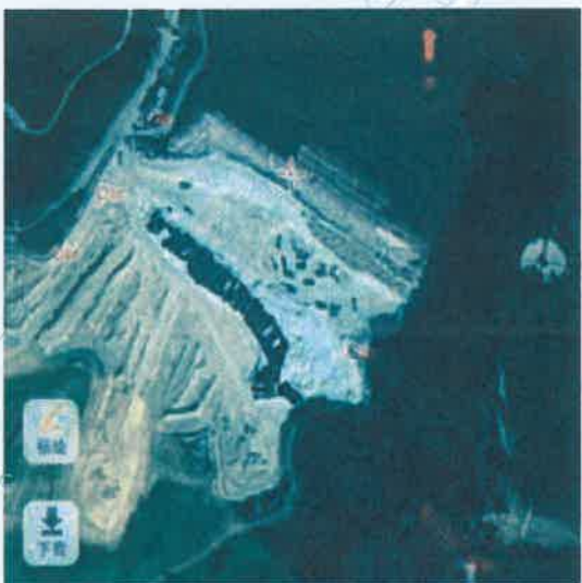
无组织废气检测点 (1号尾矿库)