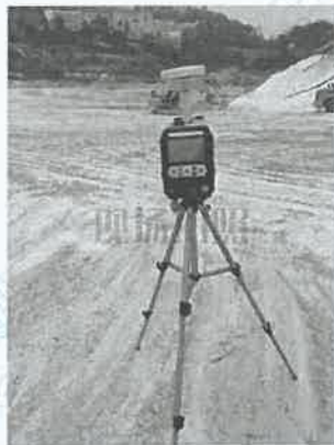
1 号尾矿库坝面 3#下风向