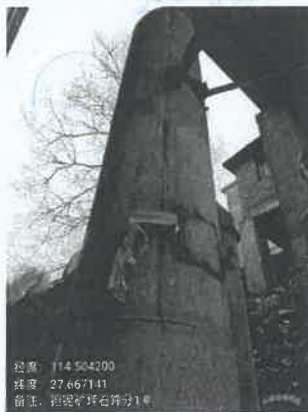
坪石选矿厂筛分除尘器 出口 1#