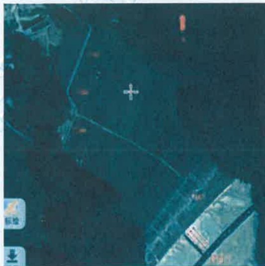
无组织废气检测点 (2号尾矿库)