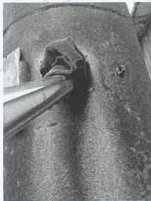
钟家市选矿厂筛分除尘器出口