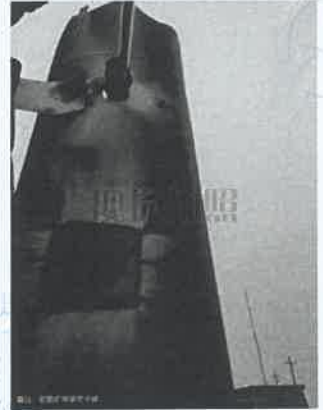
钟家市选矿厂中碎除尘器出口