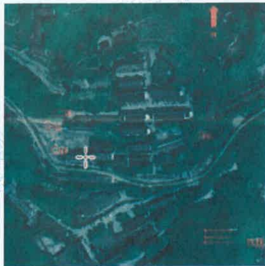
无组织废气检测点 (家属区)