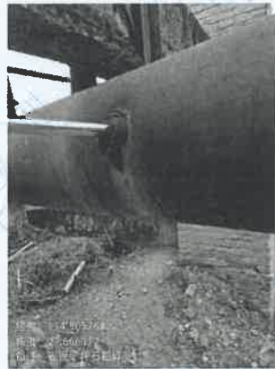
坪石选矿厂粗碎除尘器出口