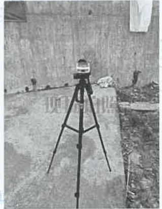
坪石选矿厂噪声监测 12#