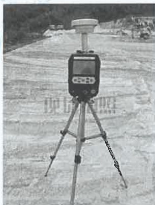
1 号尾矿库坝面 1#上风向