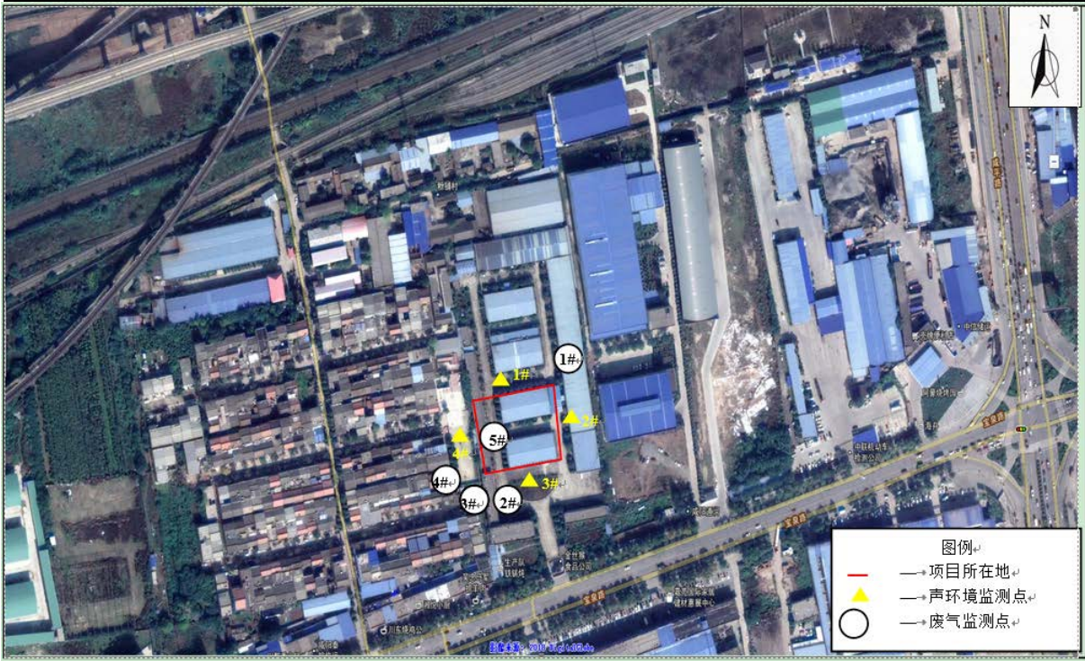
图 6-1 监测点位图