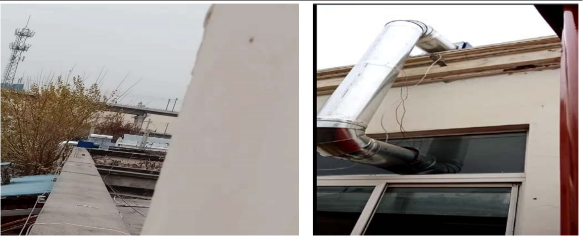
图 3-1 油烟净化器及烟道