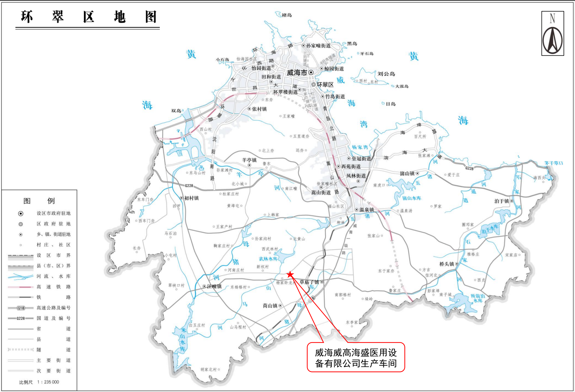
附图1 项目所在地理位置示意图 比例尺1: 235000