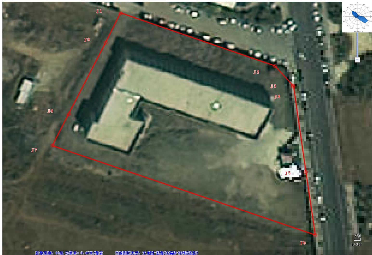
图 2.3-1 调查范围