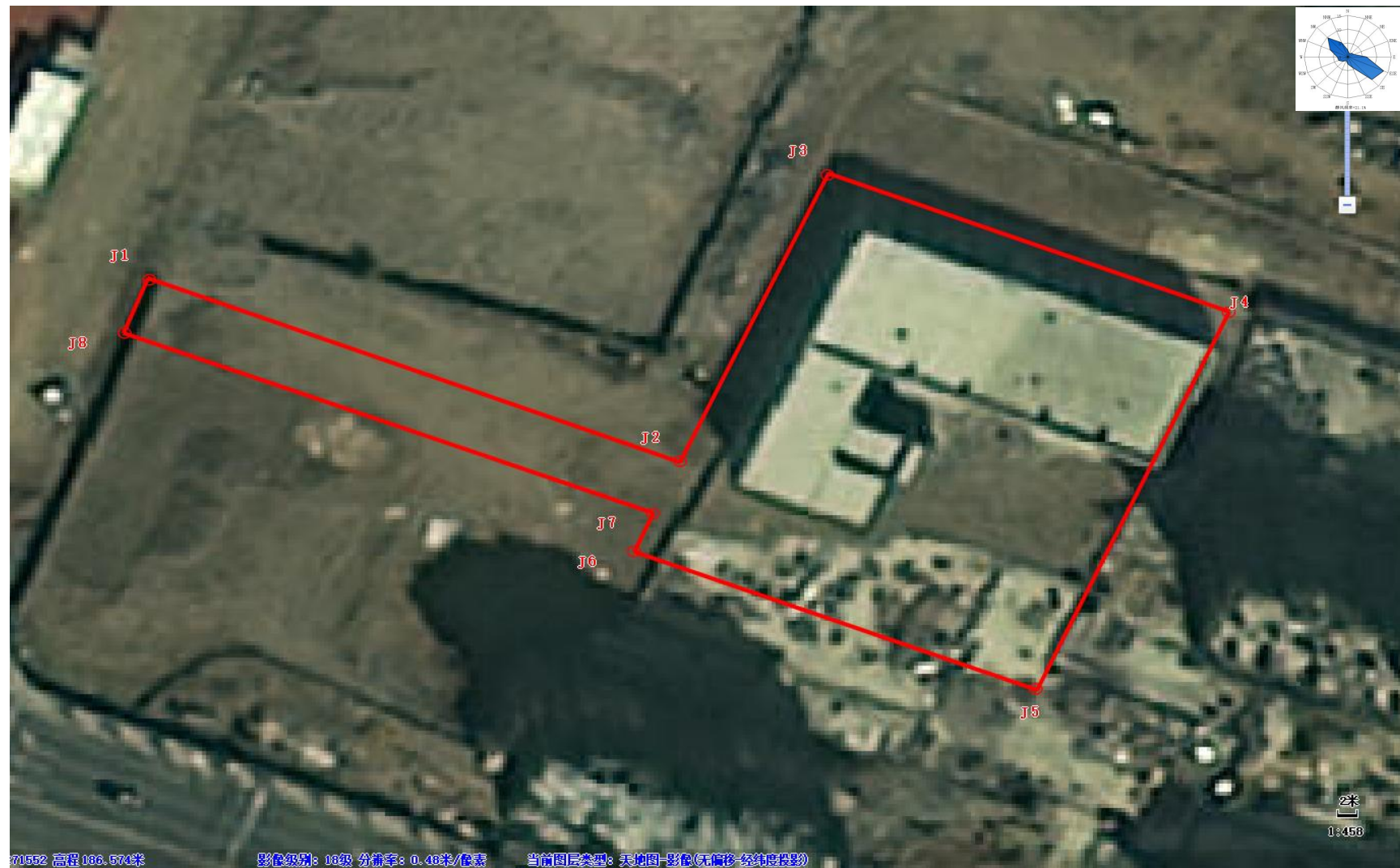
图 2.3-1 调查范围