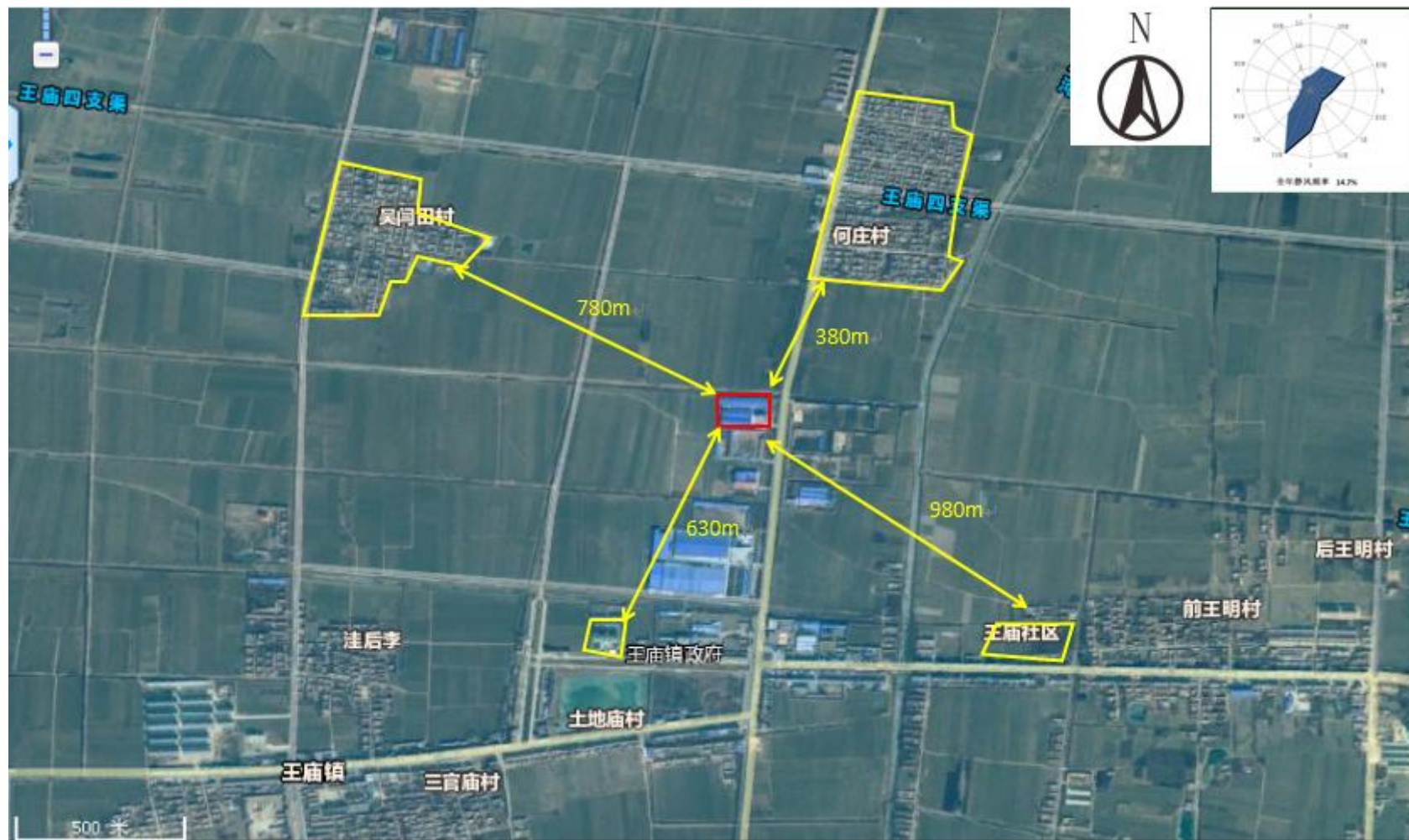
附图2 项目周边敏感目标分布图