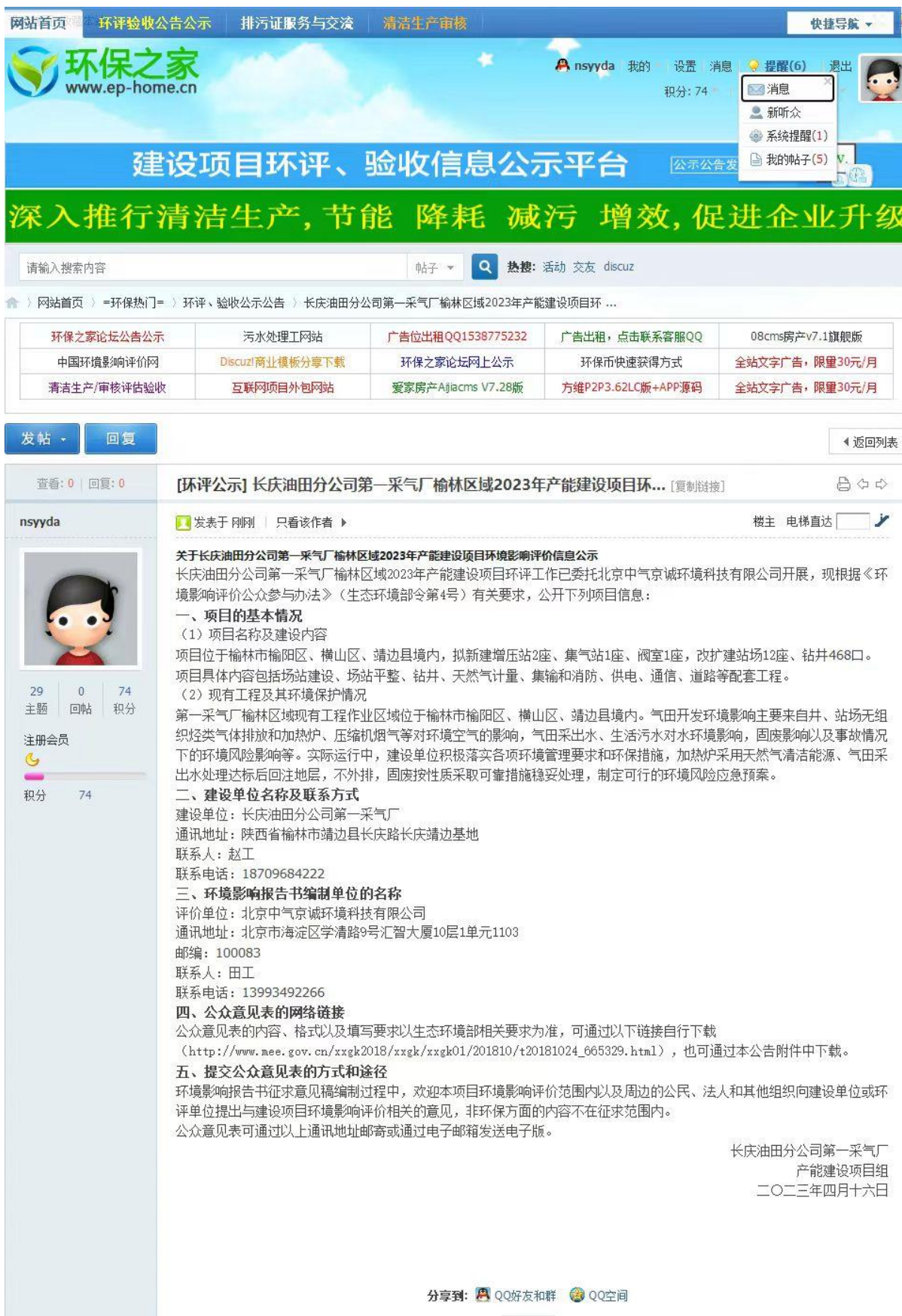
图 2-1 第一次网站公示照片