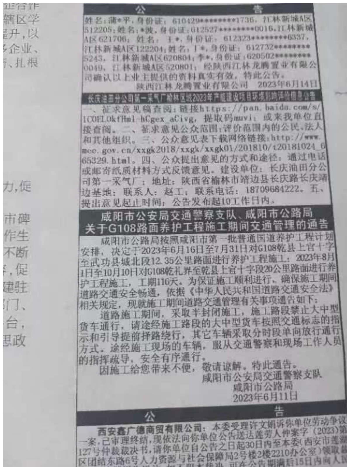
图 3-3 报纸公示 (2023 年 6 月 15 日)