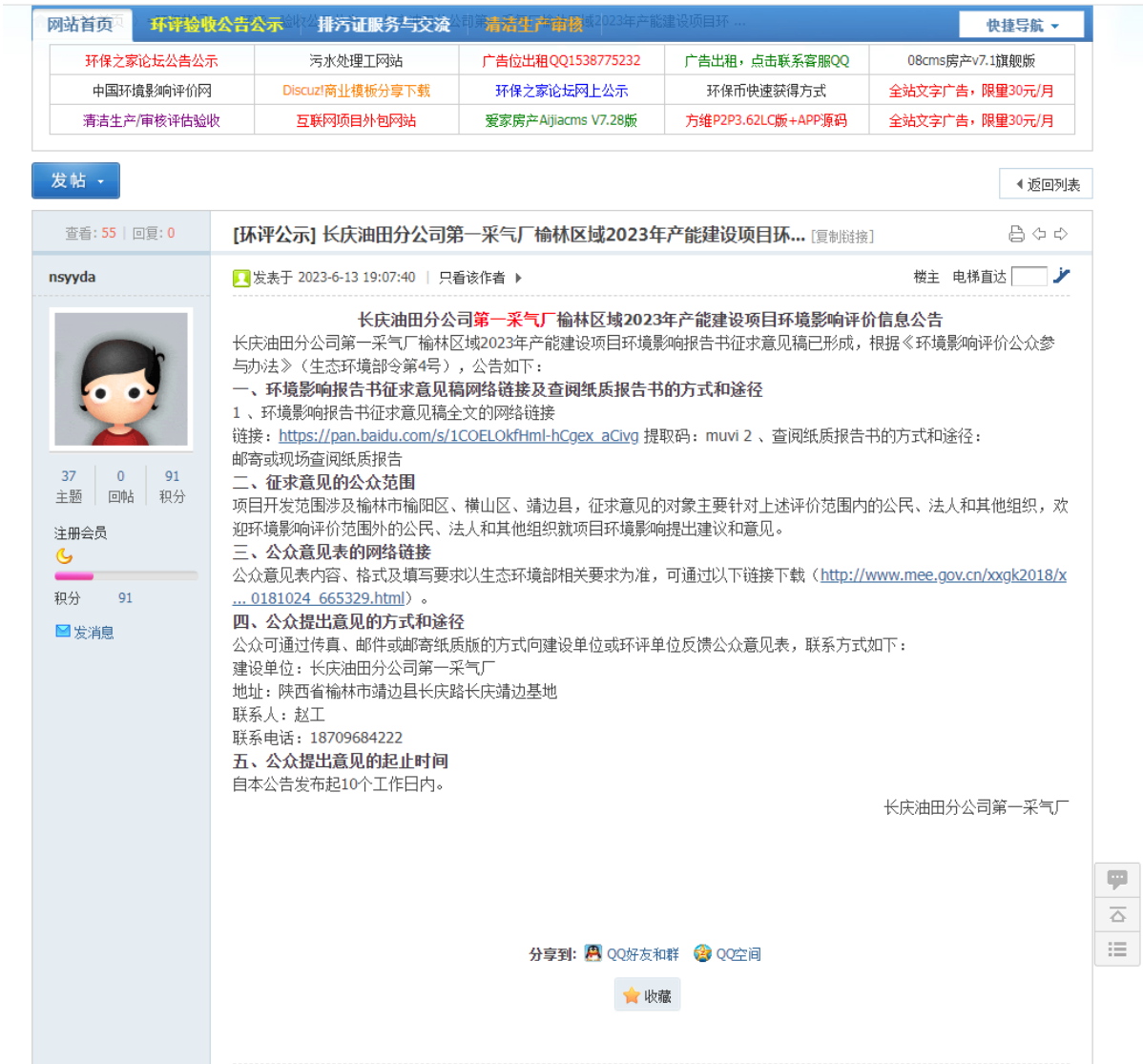
图 3-4 网站征求意见公示截图

( https://www.ehome.cn/forum.php?mod=viewthread&tid=15749&highlight=%E7%AC%AC%E4%B8%80%E9%87%87%E6%B0%94%E5%8E%82 ) 公示了环评报告全文, 见图 3-4。在报纸公示和张贴公示中均有该全文公示的网址链接。