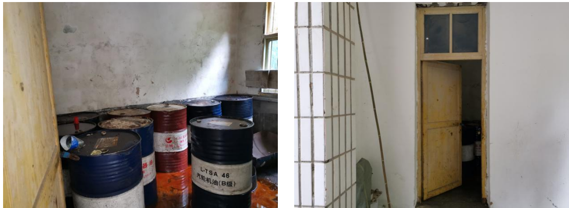
图 6 危废暂存间

根据调查，项目运营期主要危废为废机油和废油桶，产生量分别为 0.17t/a、0.1t/a，废机油和废油桶一起暂存于危废暂存间，危废暂存间与梅子水一级电站共用，一级电站危废暂存间距离二级电站厂房距离为 1000m，设置位置为一级电站厂区进口右侧，面积为 15m 2 ，当危废储存到达一定量是定期交由恩施市绿域环保科技有限公司进行处理，针对生活垃圾设置垃圾分类收集桶，定期交由环卫收集处理，目前危废暂未进行转运。