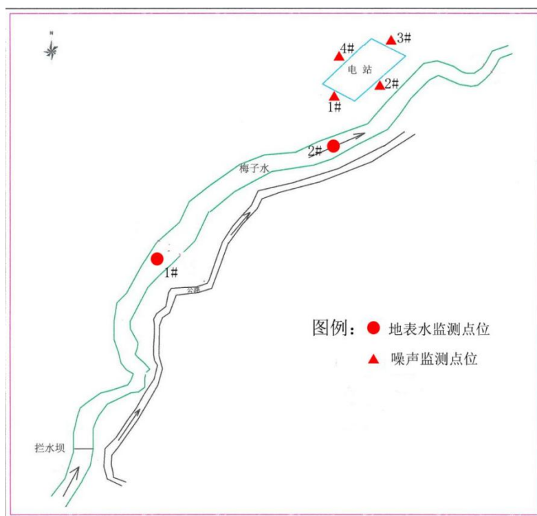
图 1 监测点位图