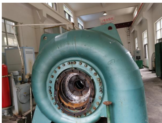
图 5 检修照片