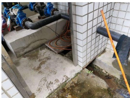
图 4 废水环境保护措施（化粪池）

根据现场调查，本项目依托原有厂区化粪池，生活废水经化粪池处理后用于附近耕地或山林施肥，因设备进行保养和维修时，设备保持干燥，且使用润滑油部位不会与水直接接触，因此环评中所述废油水，项目实际不产生。