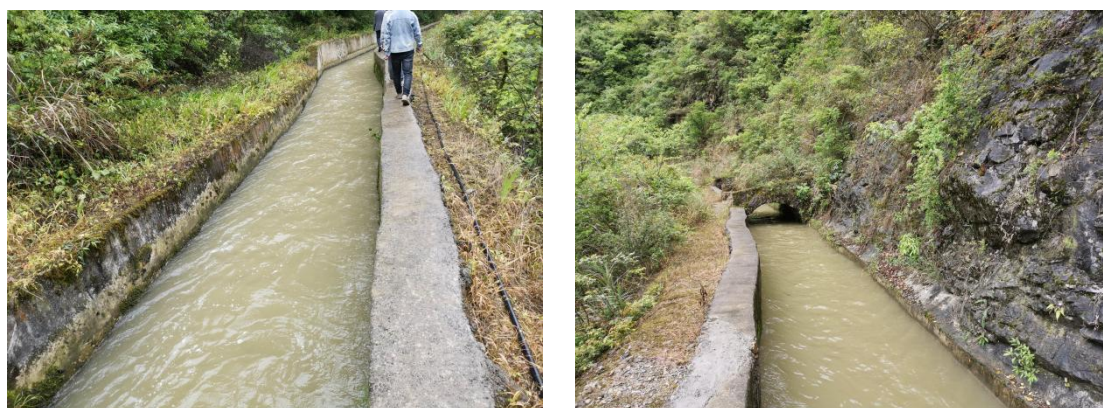
图 2 施工区植被现状图

根据调查，电站使用面积为 3016m 2 ，本次增效扩容改造项目在原电站的用地方位内进行，不新增永久占地，施工辅助工程布置在电站永久占地范围内进行；工程不新增用地，施工区边缘附近植被主要为灌木和杂草。工程施工对植被的影响主要为弃渣临时堆放、建材运输和施工人员行走等对施工区附近植被的影响，工程施工区附近植被主要为灌木和杂草，均为一般常见种，施工期结束后，通过移栽和撒种，目前灌木和杂草已得到恢复。