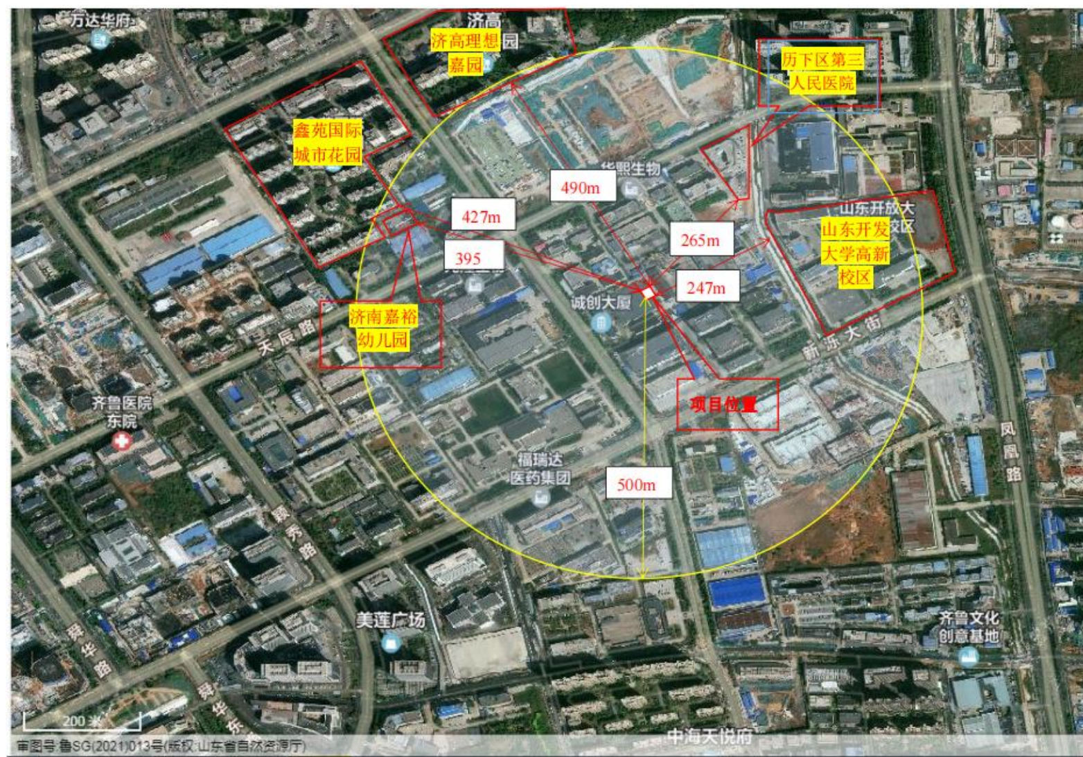
附图2 项目周边情况图