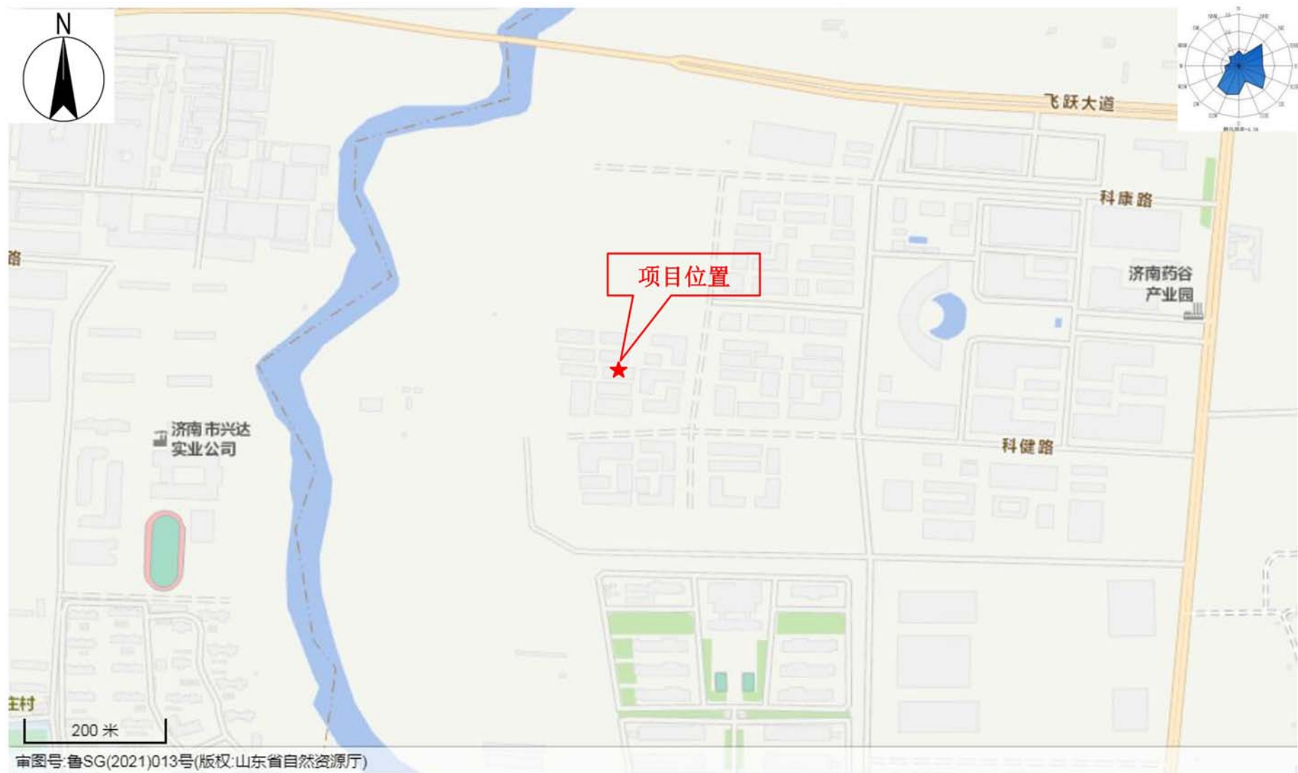
附图1 项目地理位置图