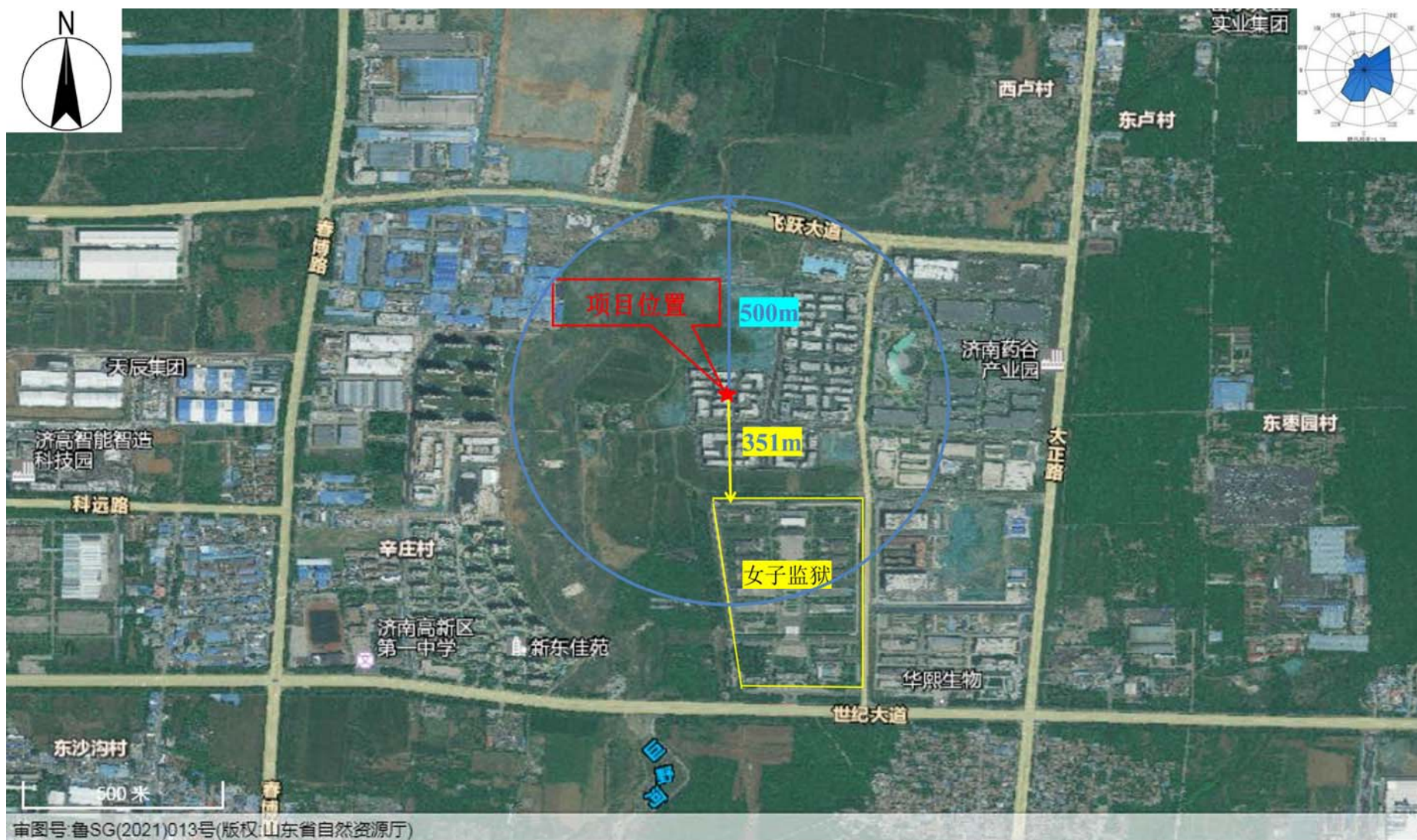
附图2 项目周边情况图