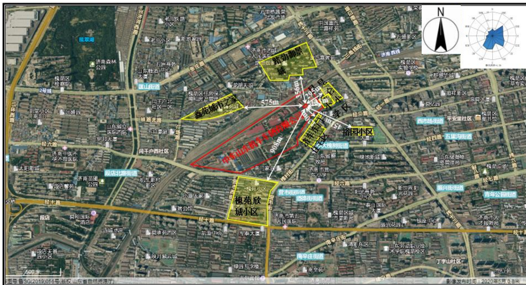
附图2 项目周边情况图