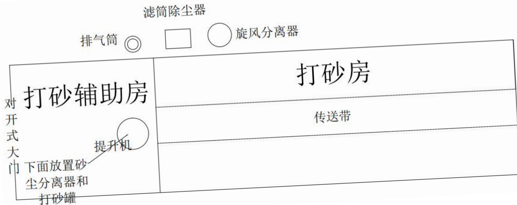
附图3-2 打砂房平面布置图 (1:1000)