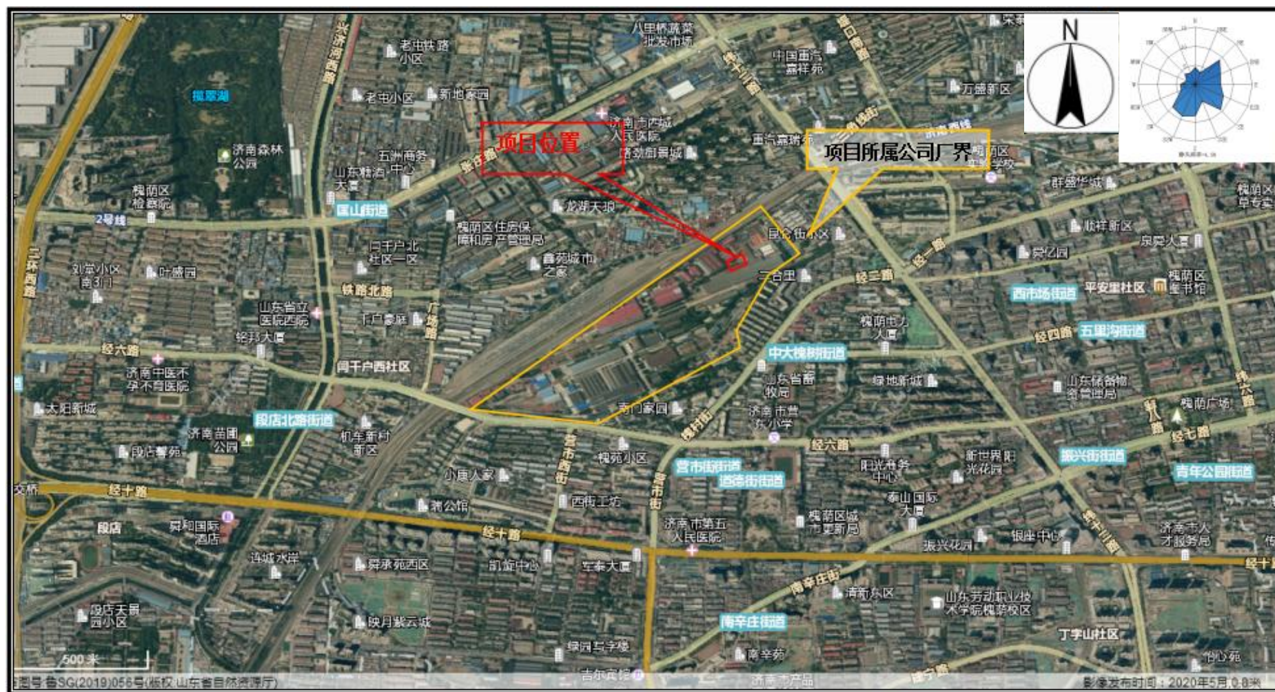
附图1 项目地理位置图