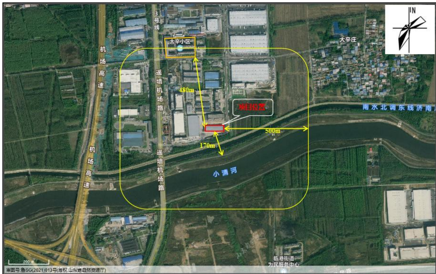
附图2 项目周边情况图