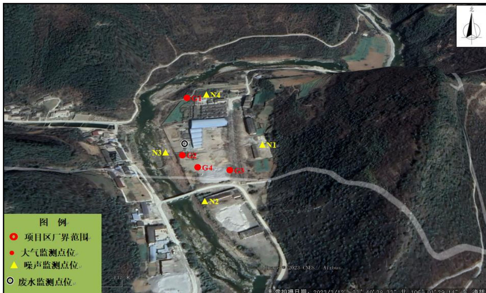
图 3 环境质量监测点位布设图