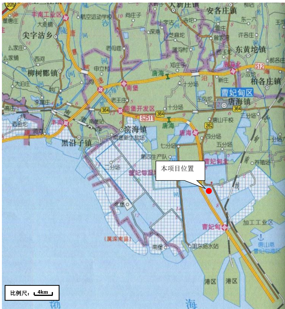
附图 1 项目所在地理位置图