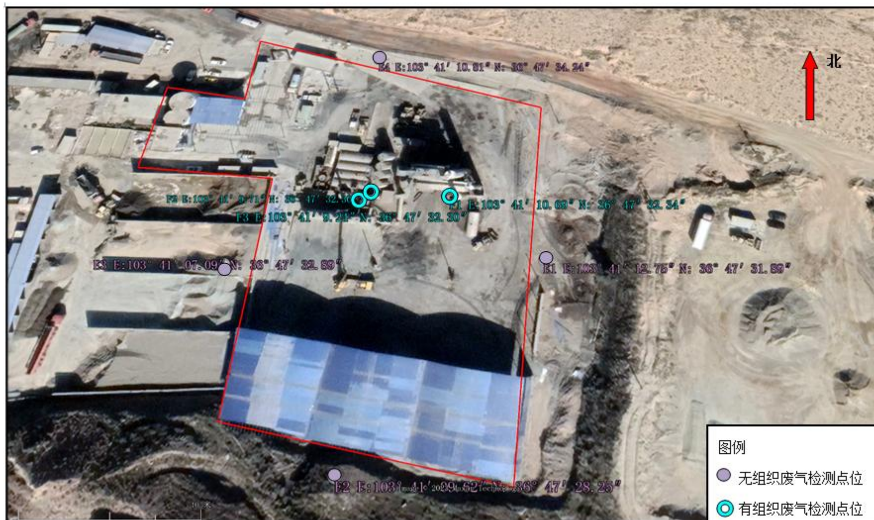
附图 6-1 废气检测点位图