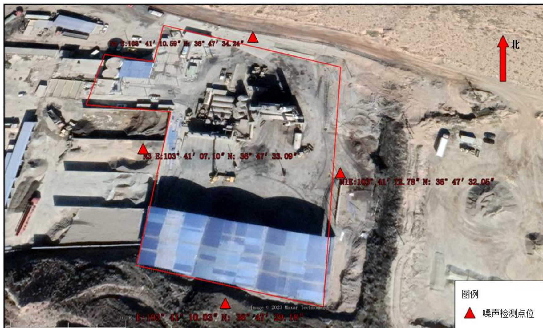
附图 6-2 噪声检测点位图