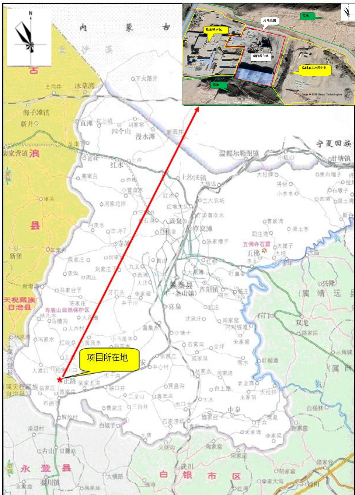
附图 2-1 地理位置图