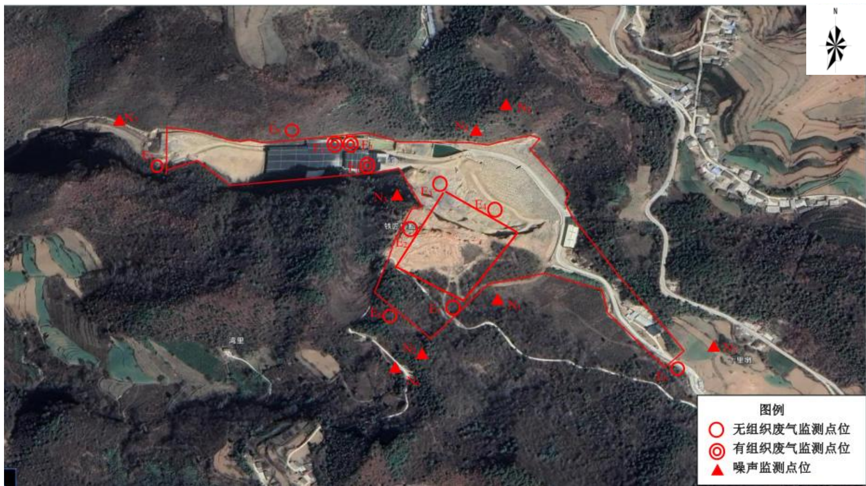
图 3 环境质量监测点位布设图