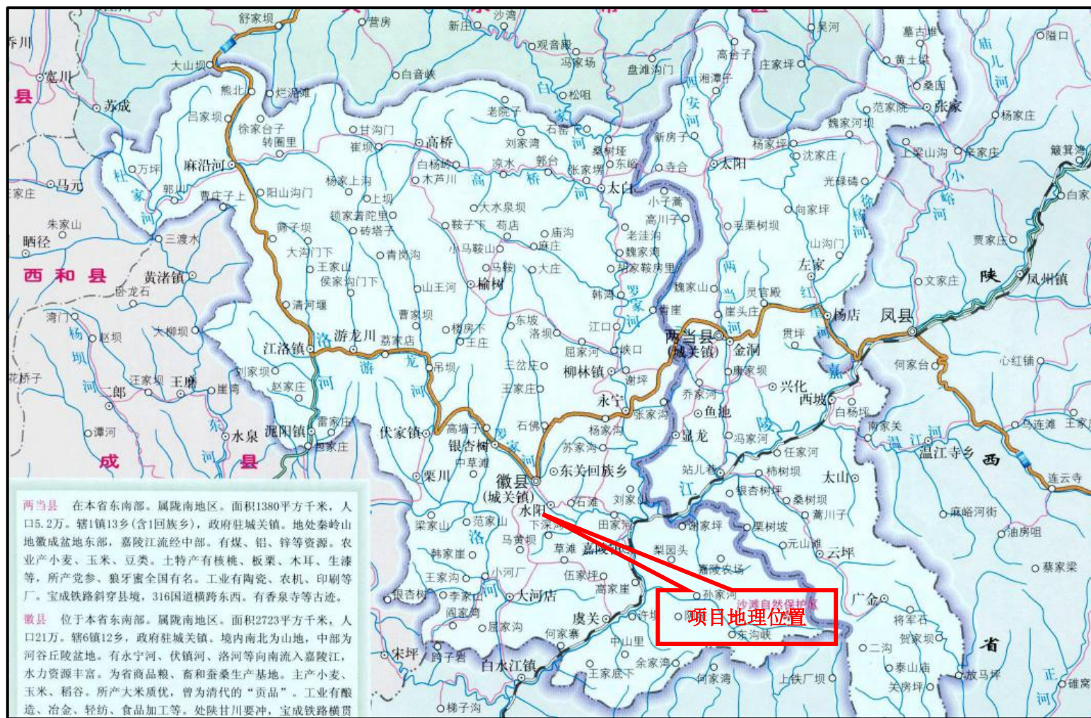
图1 项目地理位置图