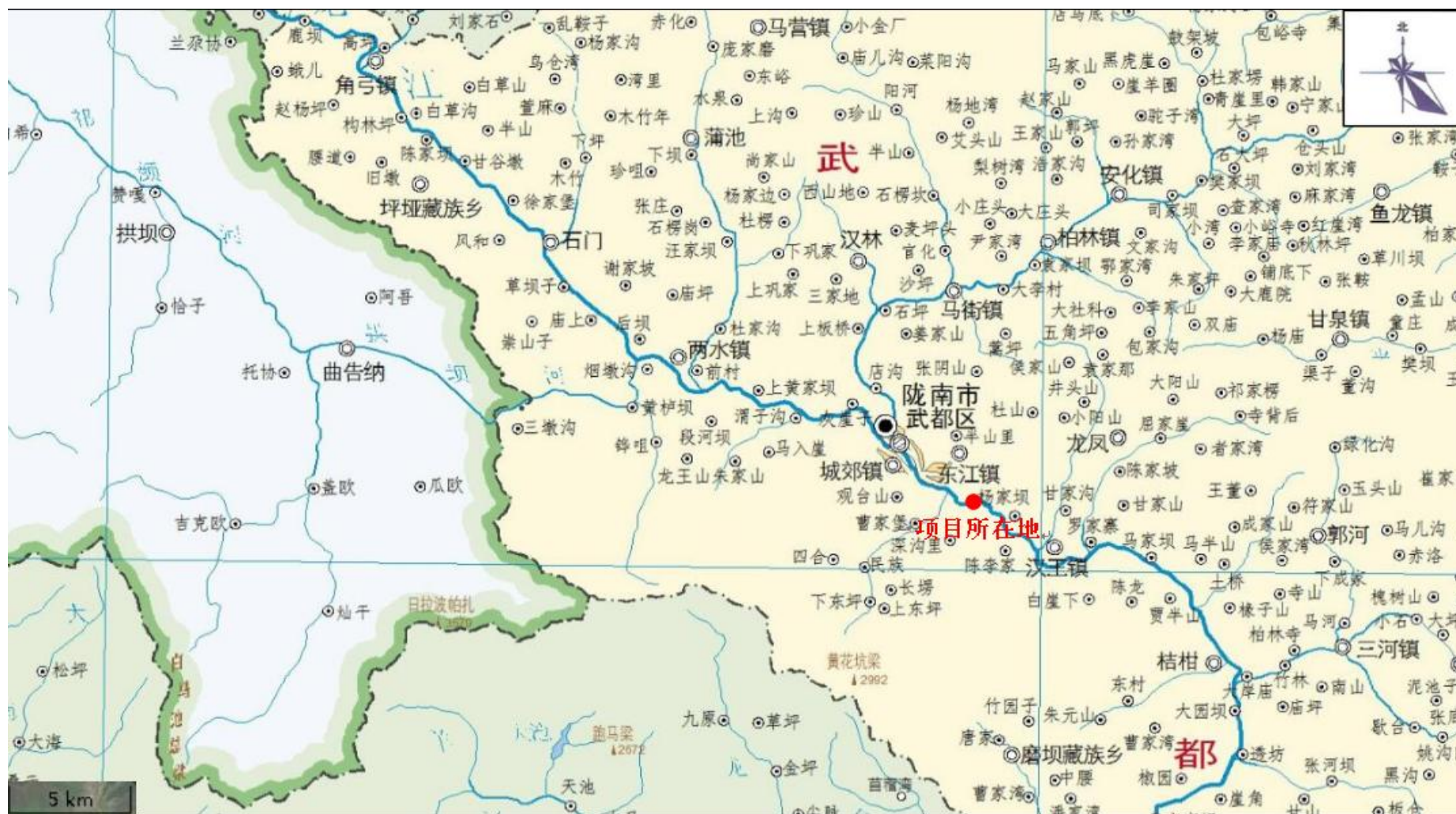
图 1 项目地理位置图