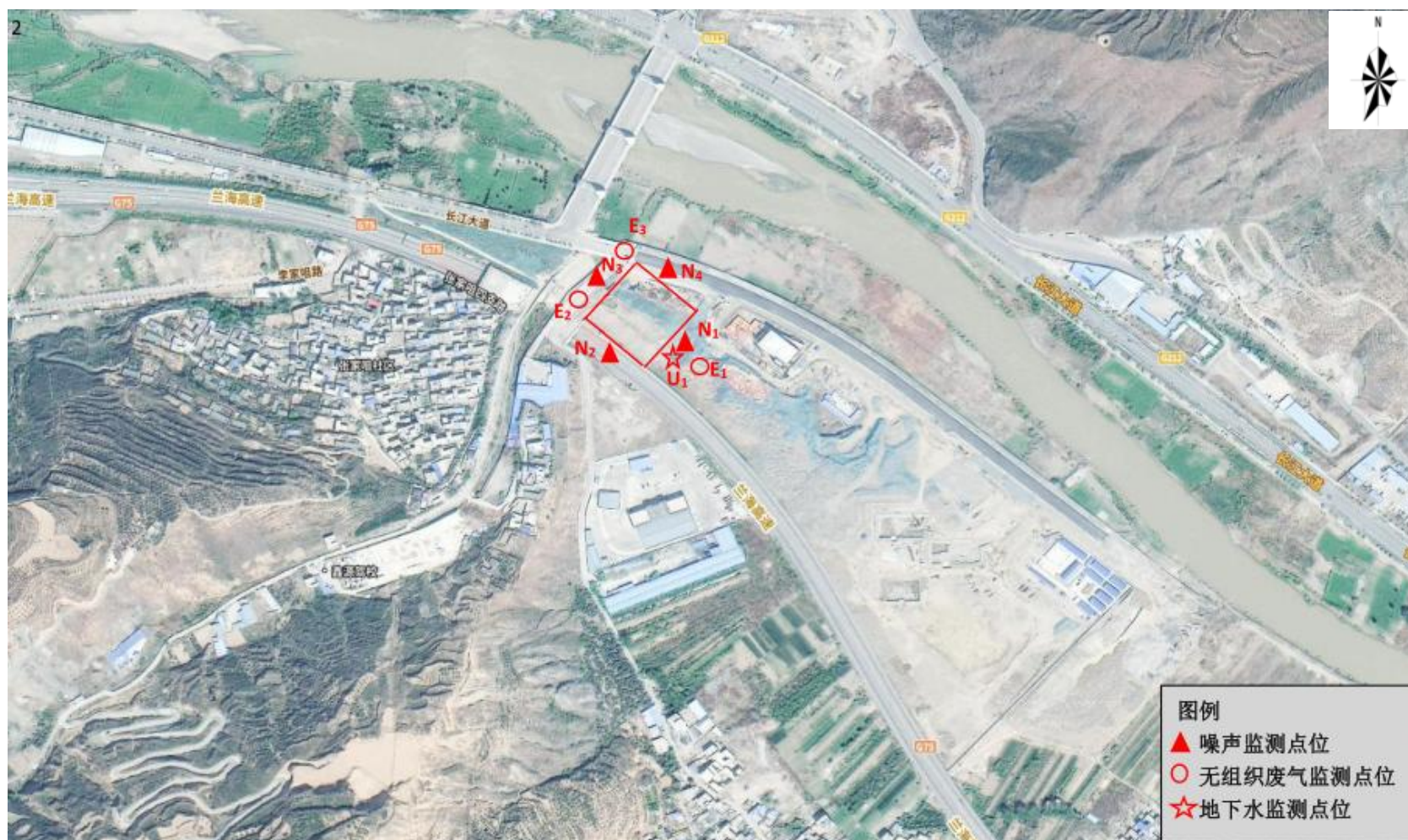
图 4 环境质量监测点位布设图