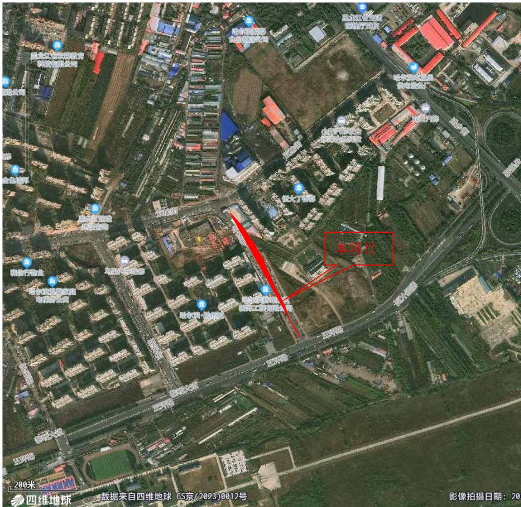
图 4-2 项目卫星图示意图