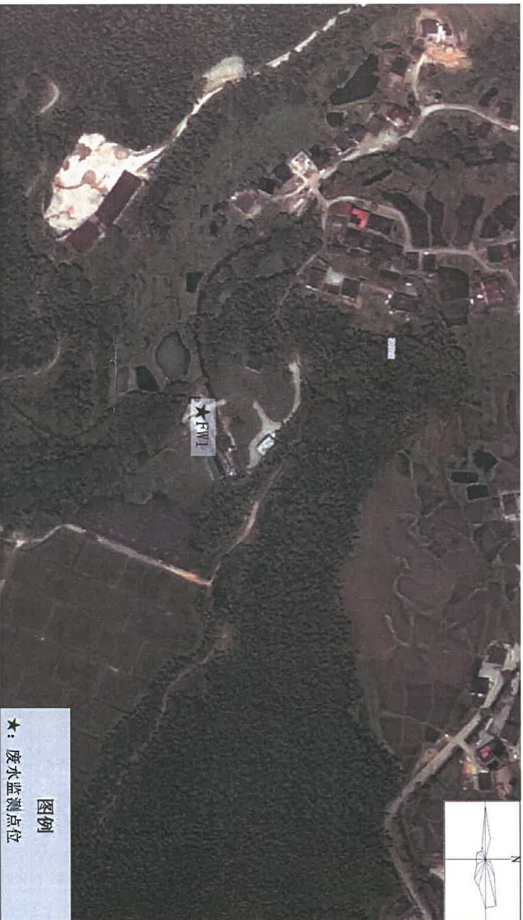
附图一：监测点位示意图