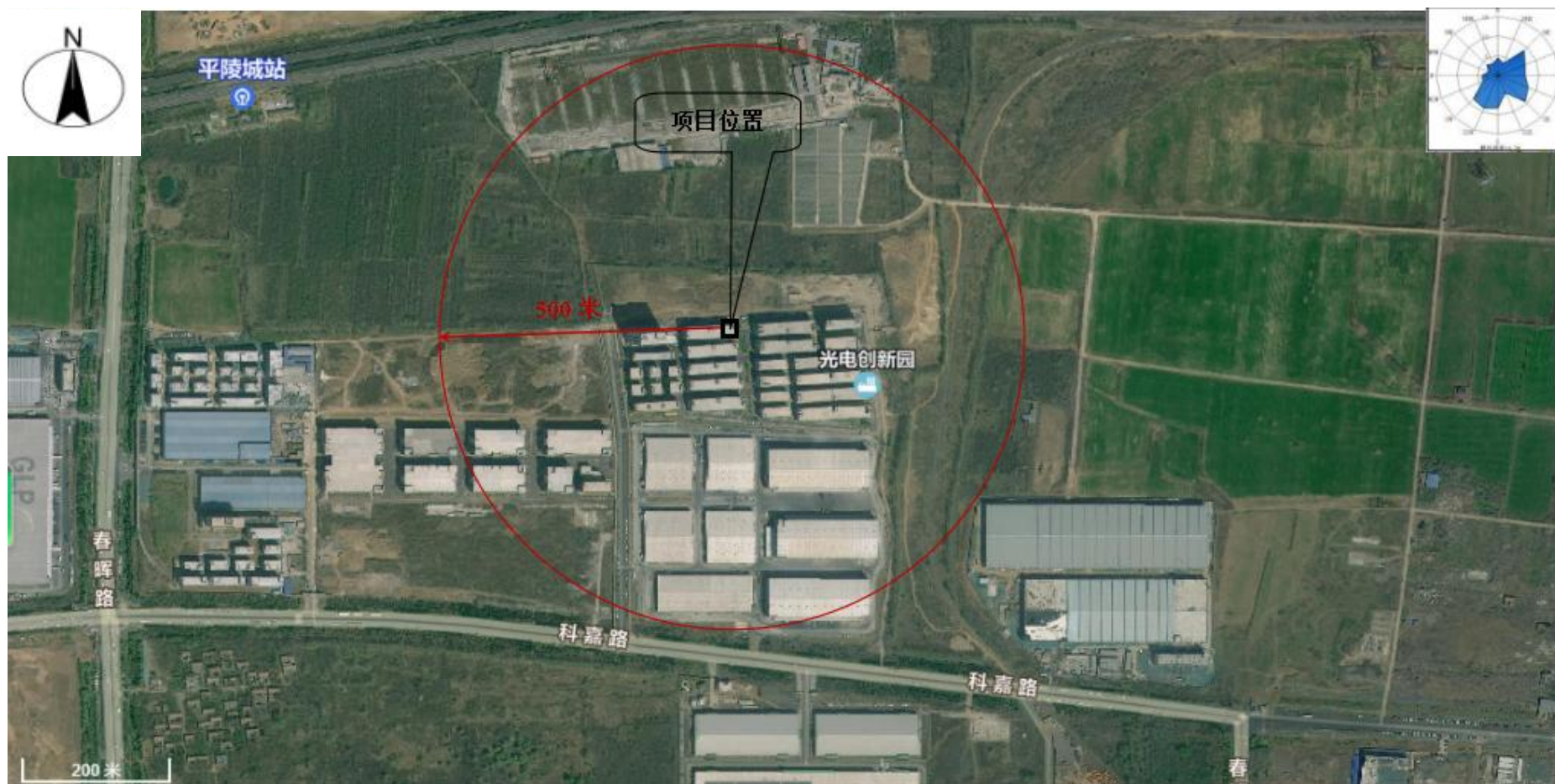
附图2 项目周边情况图