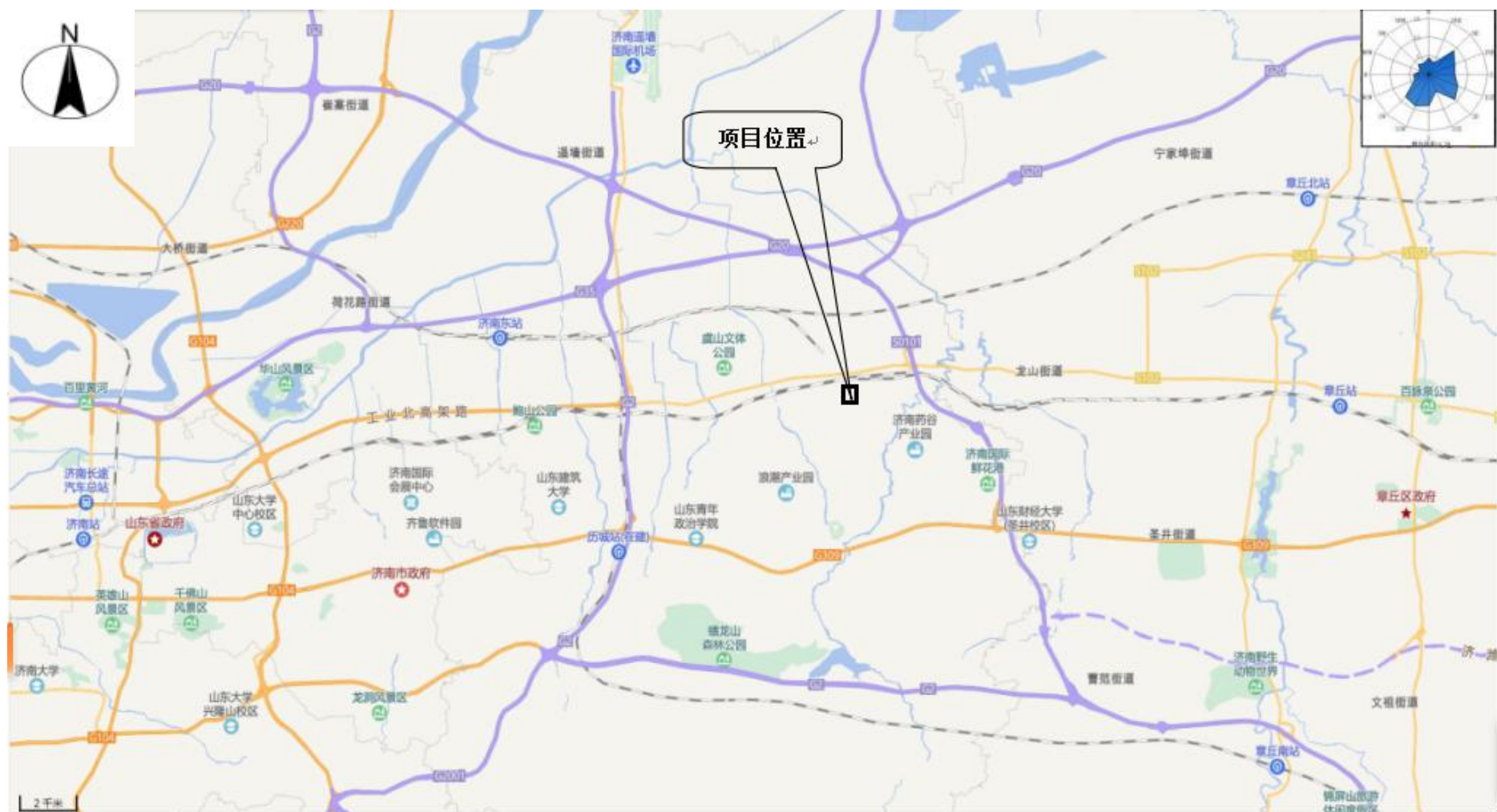
附图1 项目地理位置图