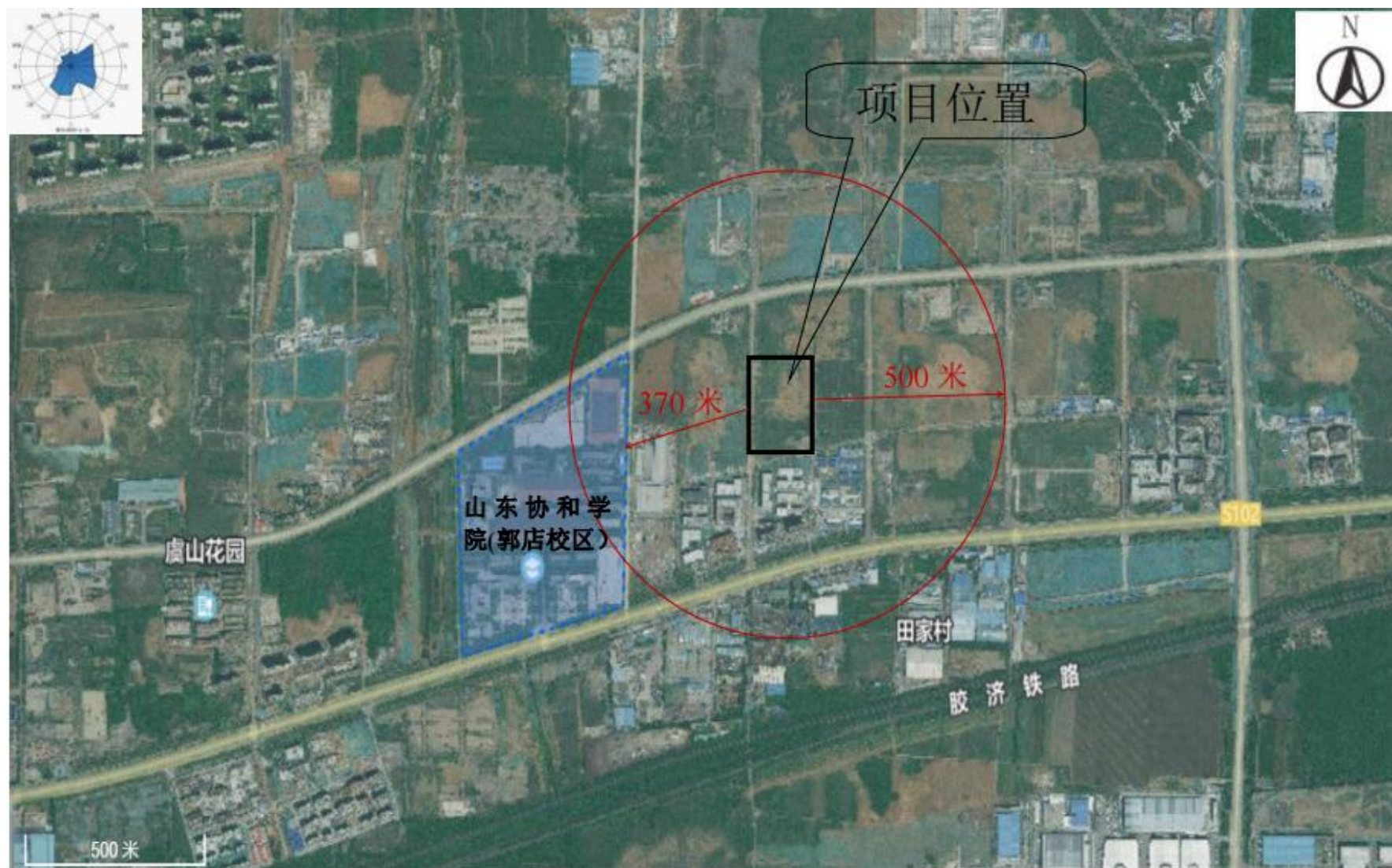
附图2 项目周边情况图