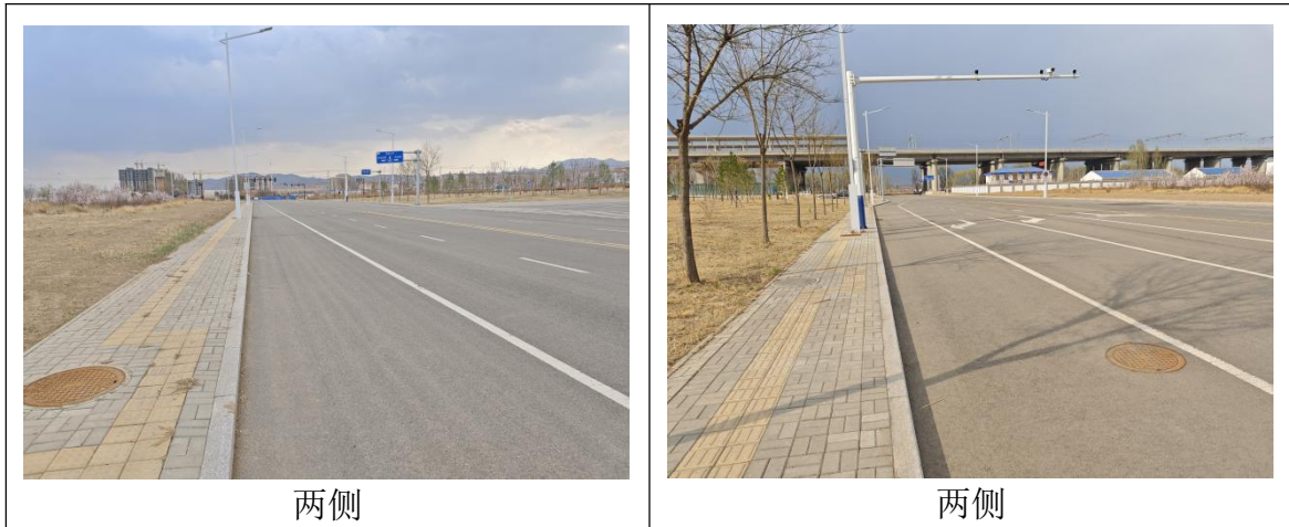
图 3-1 现场照片