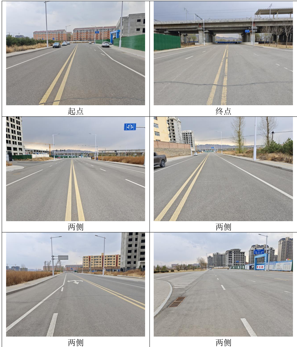
图 3-2 现场照片