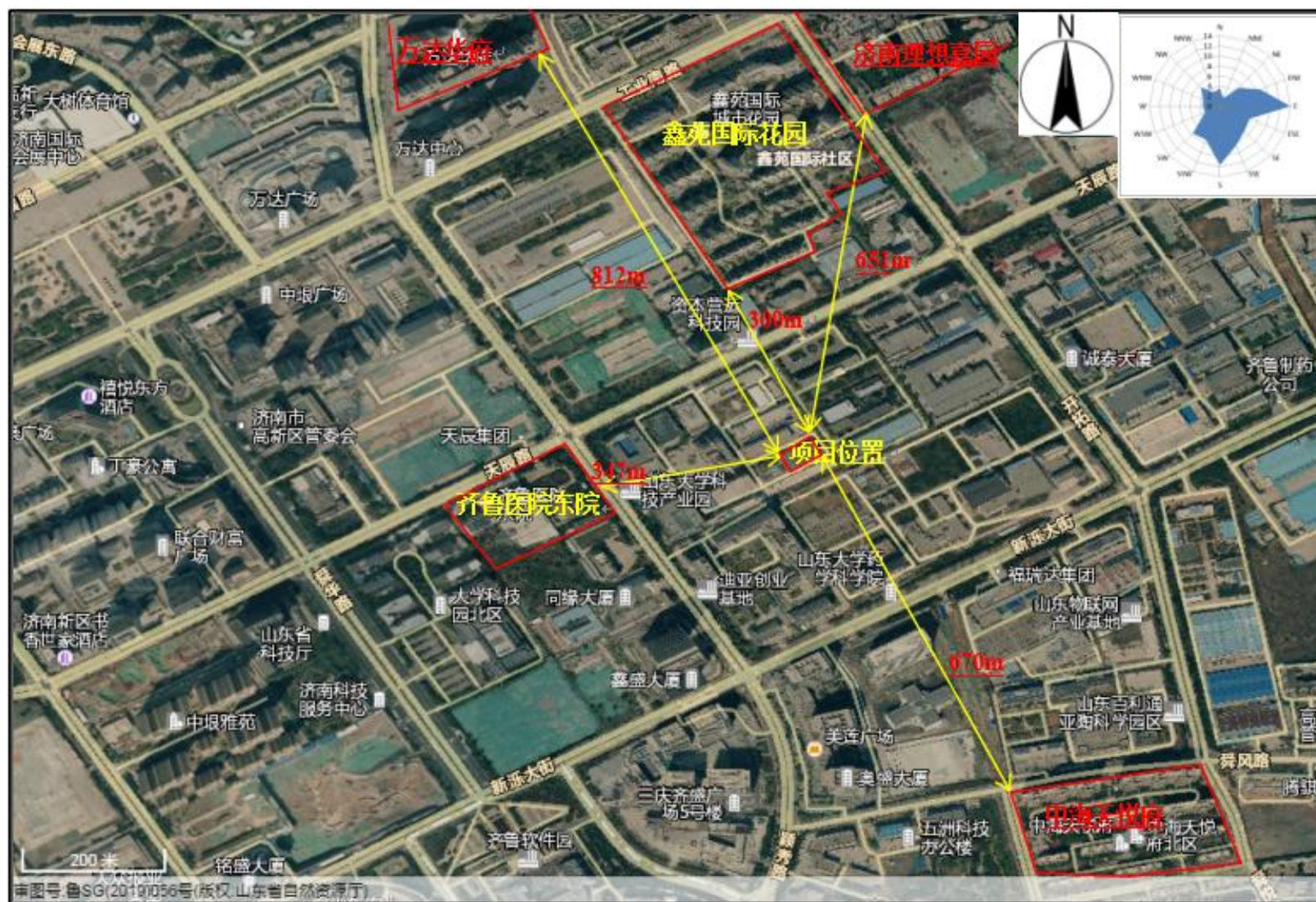
附图2 项目周边情况图