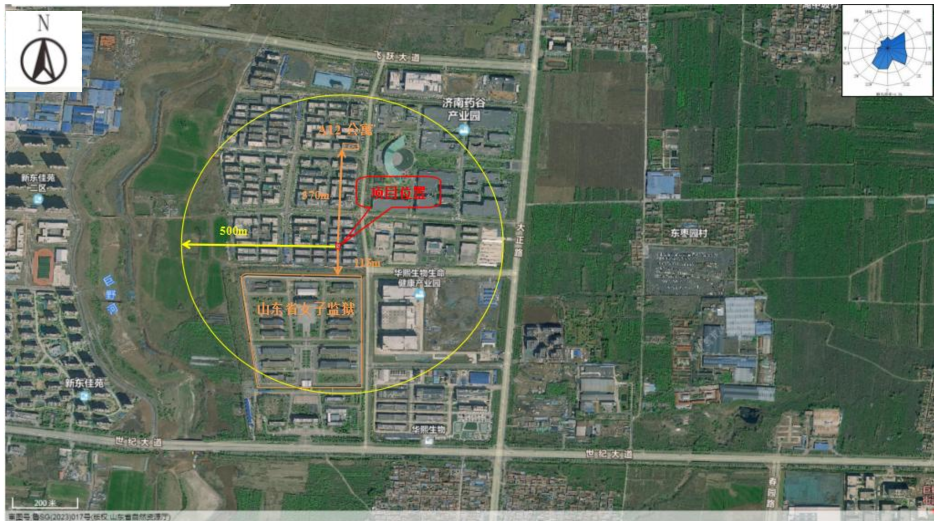
附图2 项目周边情况图