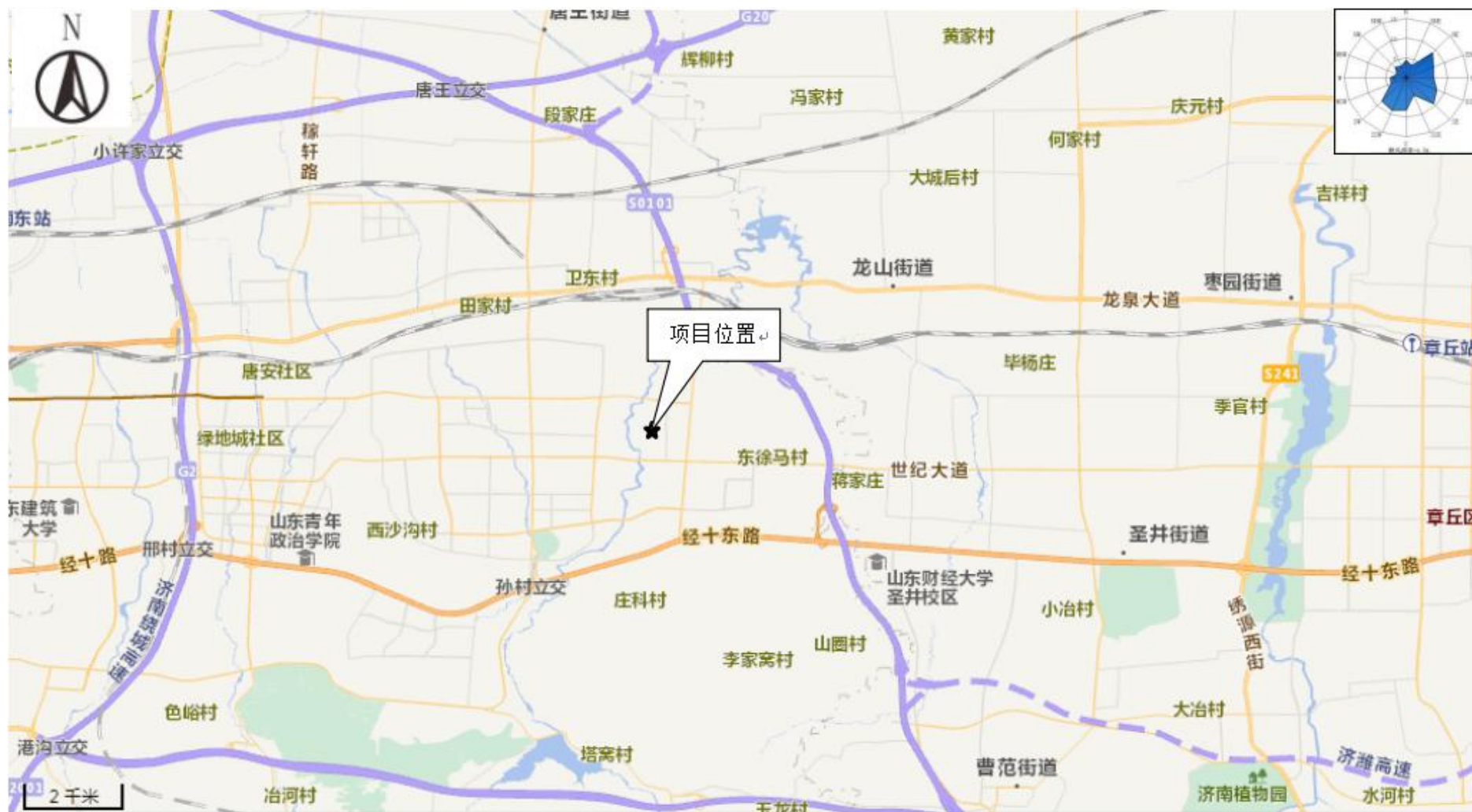
附图1 项目地理位置图