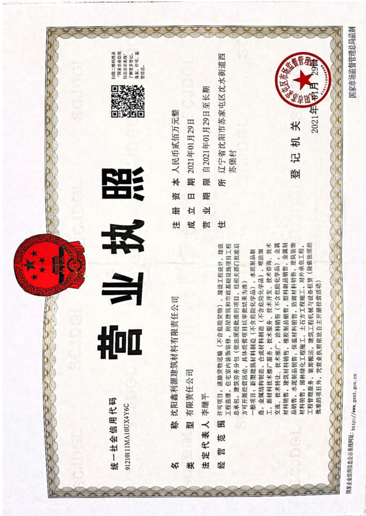
附件 1 营业执照