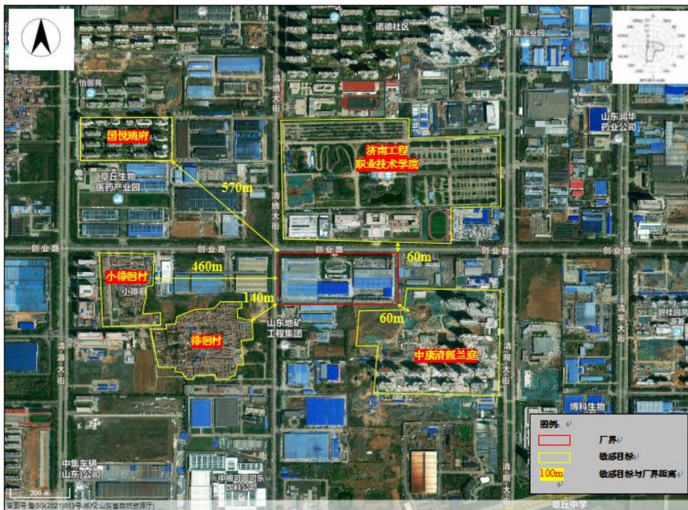
附图2 项目周边情况图