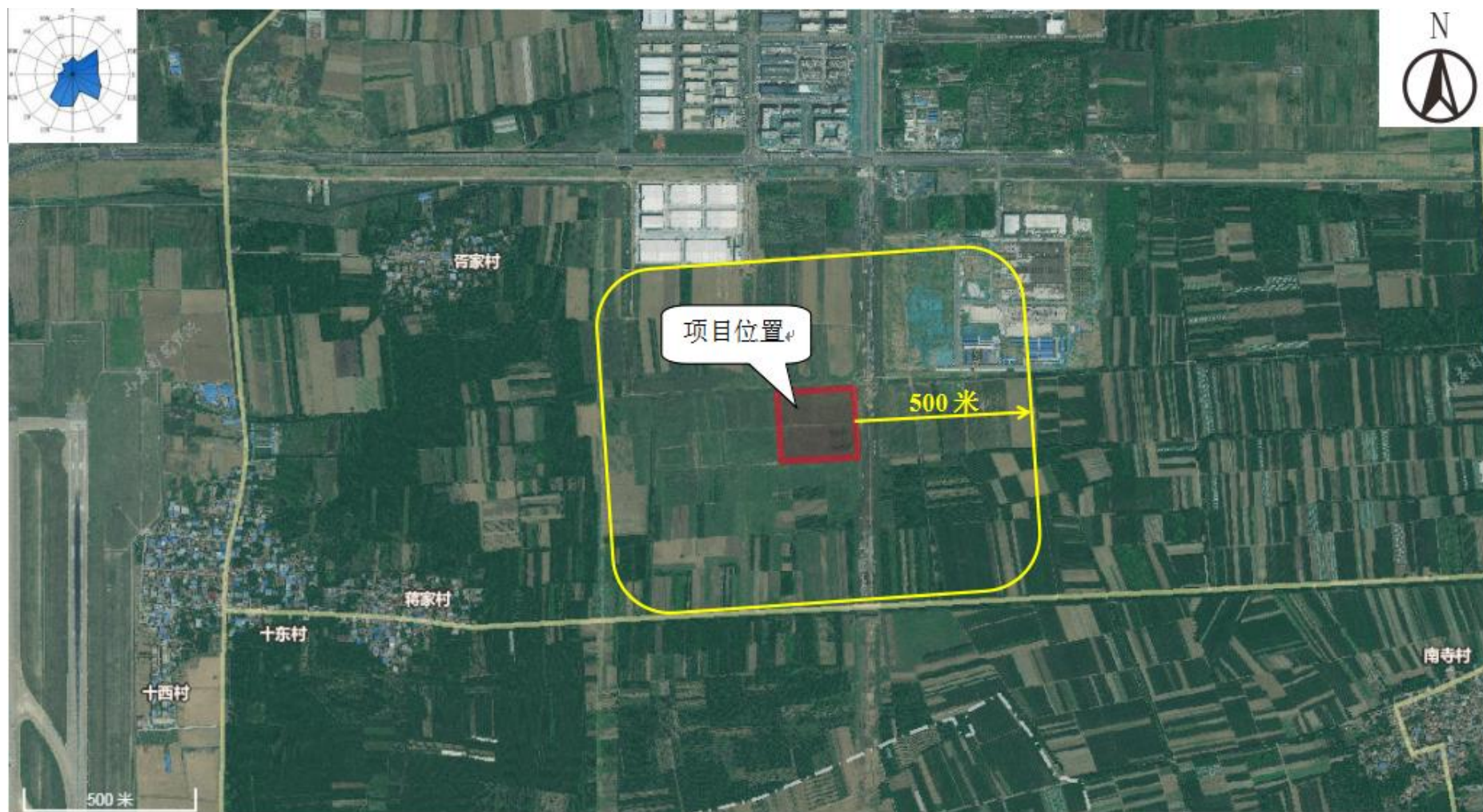
附图2 项目周边情况图