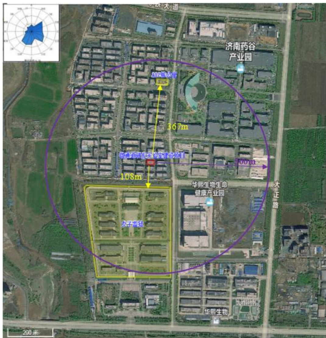
附图2 项目周边情况图