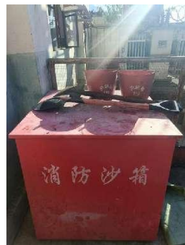
消防设施（消防沙箱）