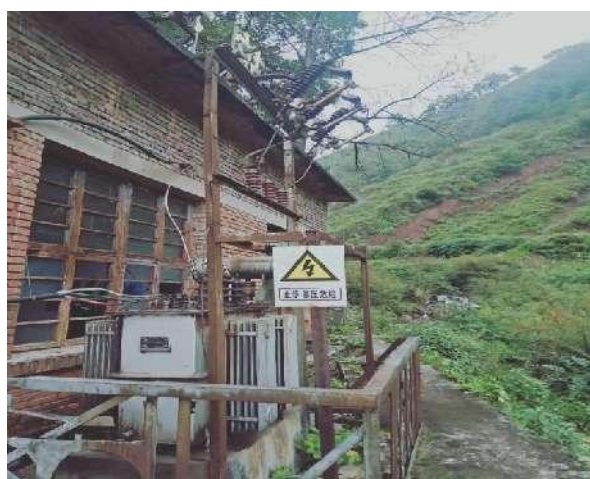
电站变压器和安全警示标示