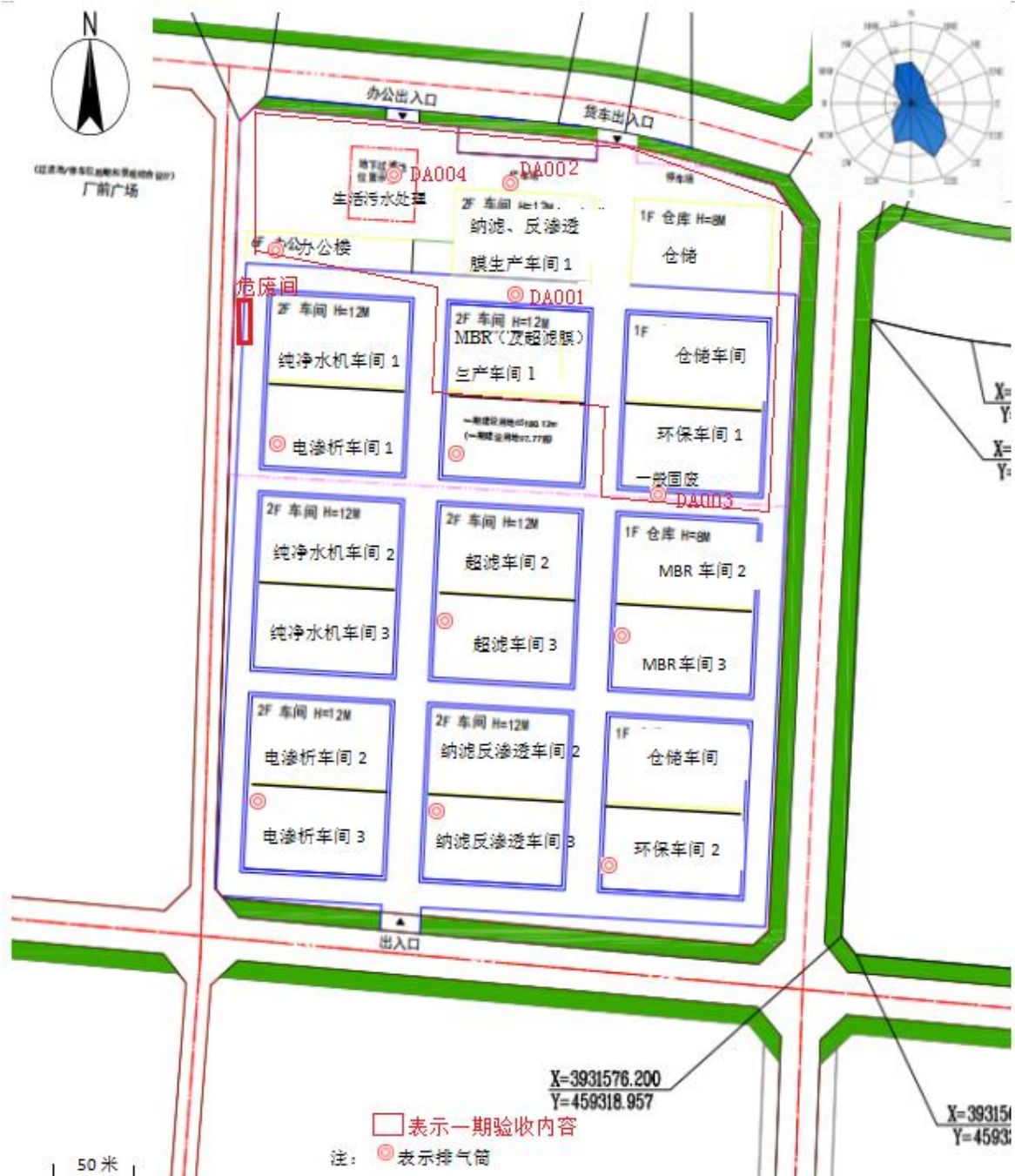
附图3 项目平面布置图