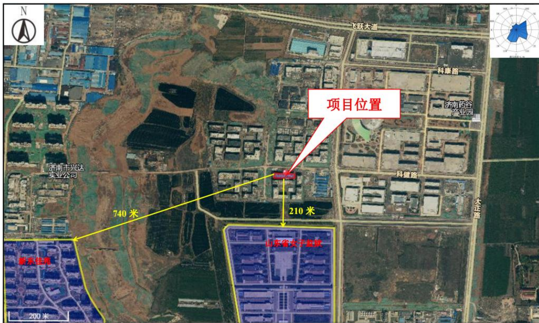
附图2 项目周边情况图