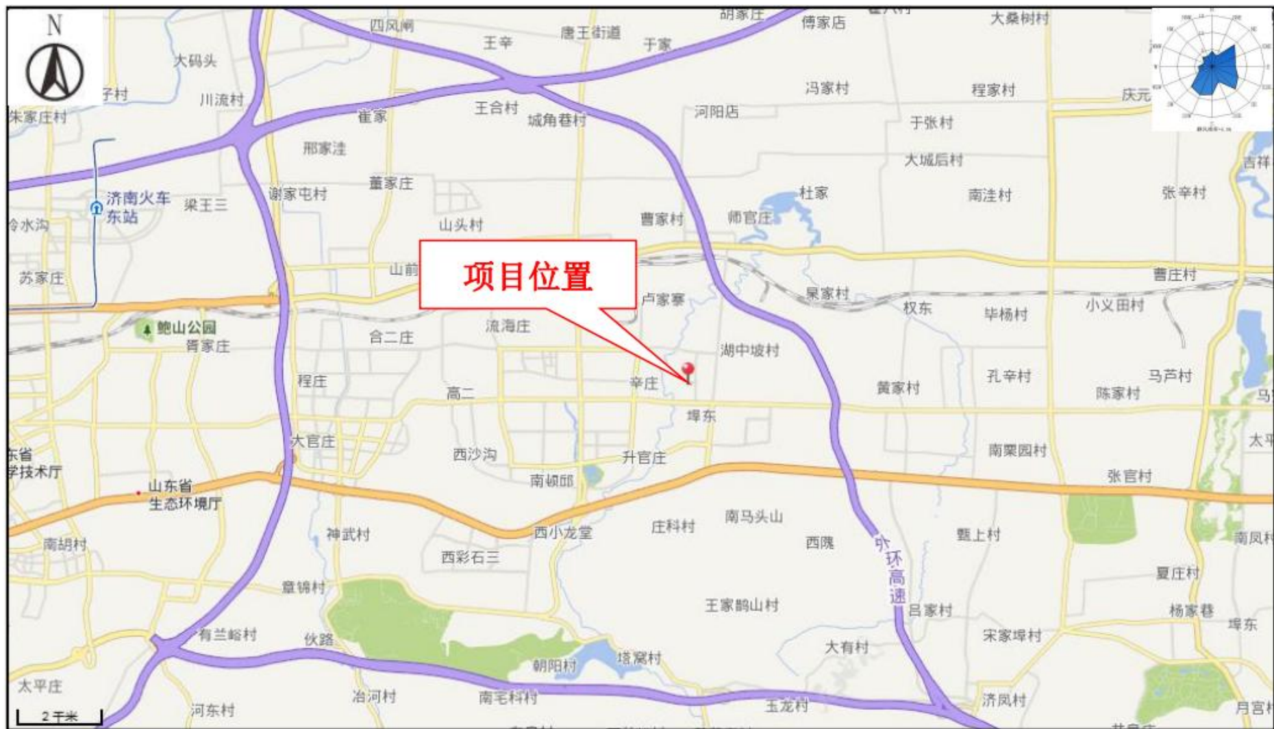
附图1 项目地理位置图