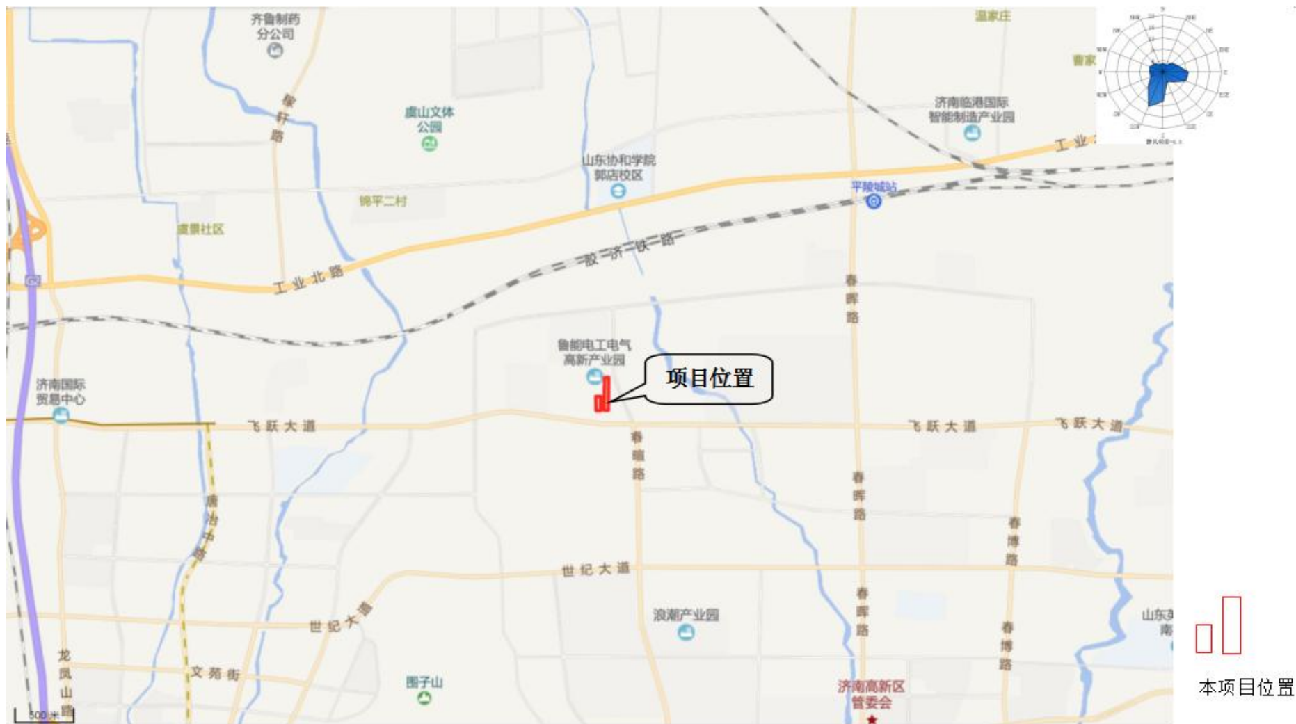
附图1 项目地理位置图