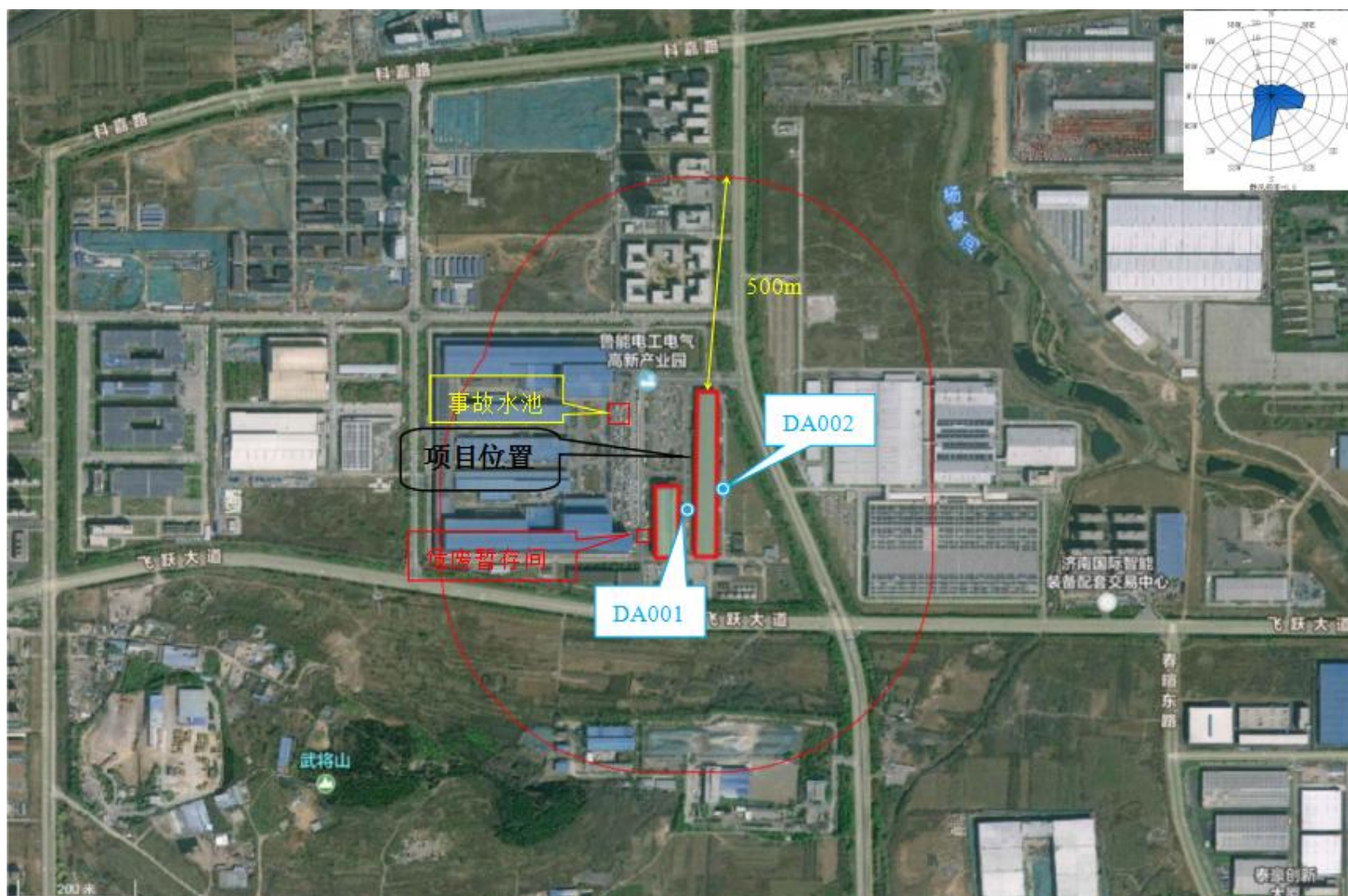
附图2 项目周边情况图