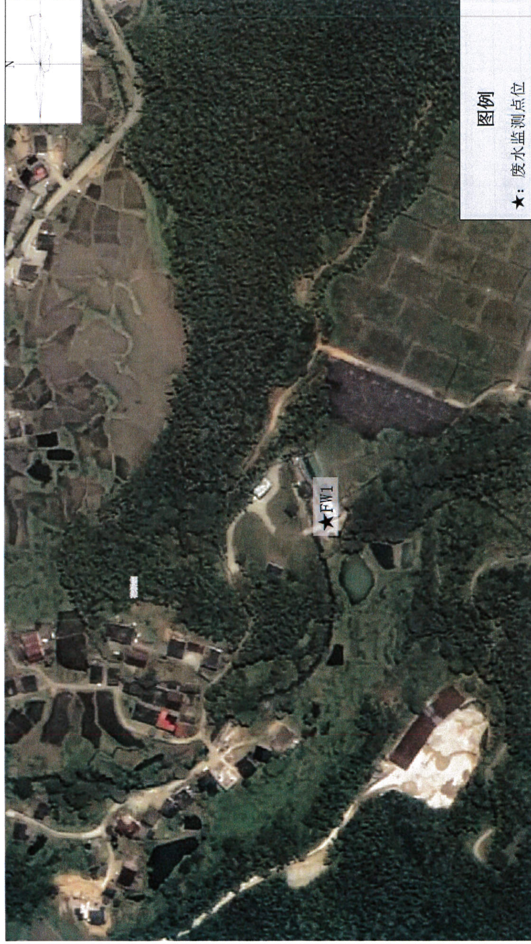
附图一：监测点位示意图