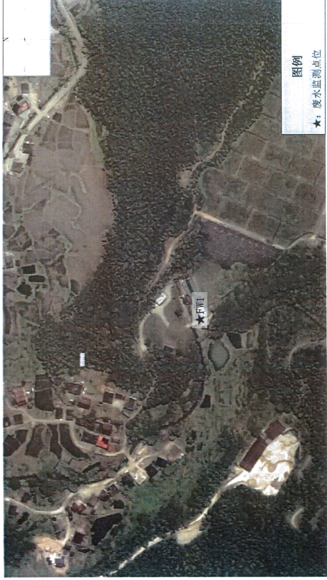
附图一：监测点位示意图