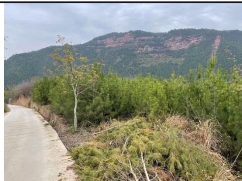
钻孔平台 ZK79-1 生态恢复后现状