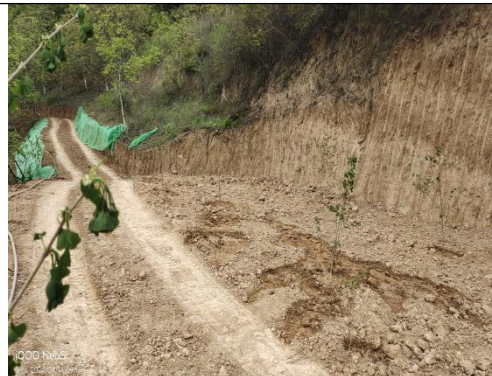
钻孔平台 ZK87-1、ZK87-2 生态恢复中现状