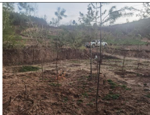
钻孔平台 ZK83-3 生态恢复中现状